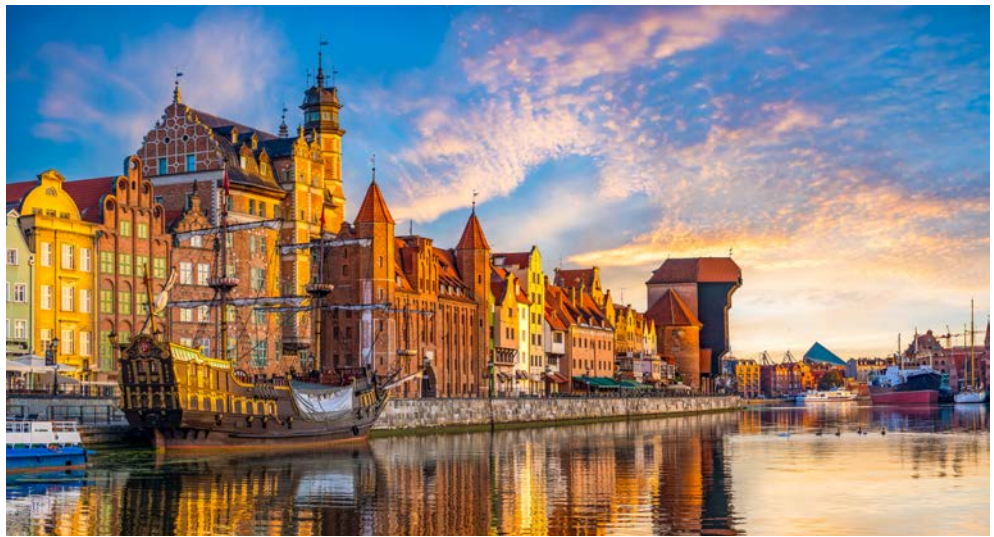
Das Krantor am Hafen der Hansestadt Danzig