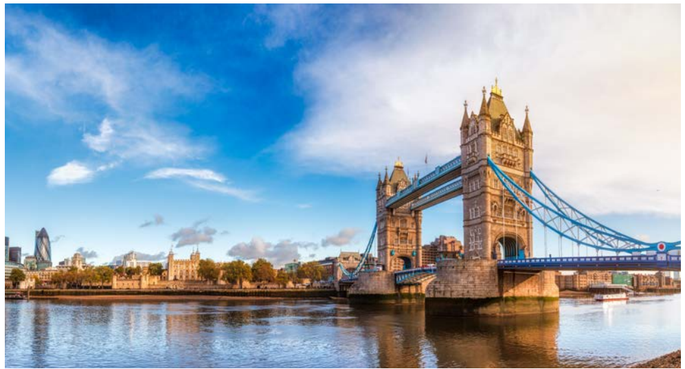
Unternehmen Sie unbedingt eine Panoramafahrt durch London