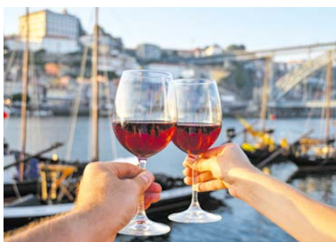
Ein Glas Portwein in Porto