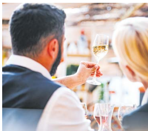
Freuen Sie sich auf Weinproben unterschiedlichster Sorten

Die englische Hafenstadt Falmouth an der Südküste Cornwalls hat einen ausgesprochen schönen Naturhafen. Sandige Buchten, eine fast schon mediterrane Flora, hübsche Häuser im georgianischen Stil und das von Heinrich VIII. erbaute Pendennis Castle. Empfehlenswert ist ein Ausflug, der Ihnen die landschaftlichen Schönheiten Cornwalls näher bringt.