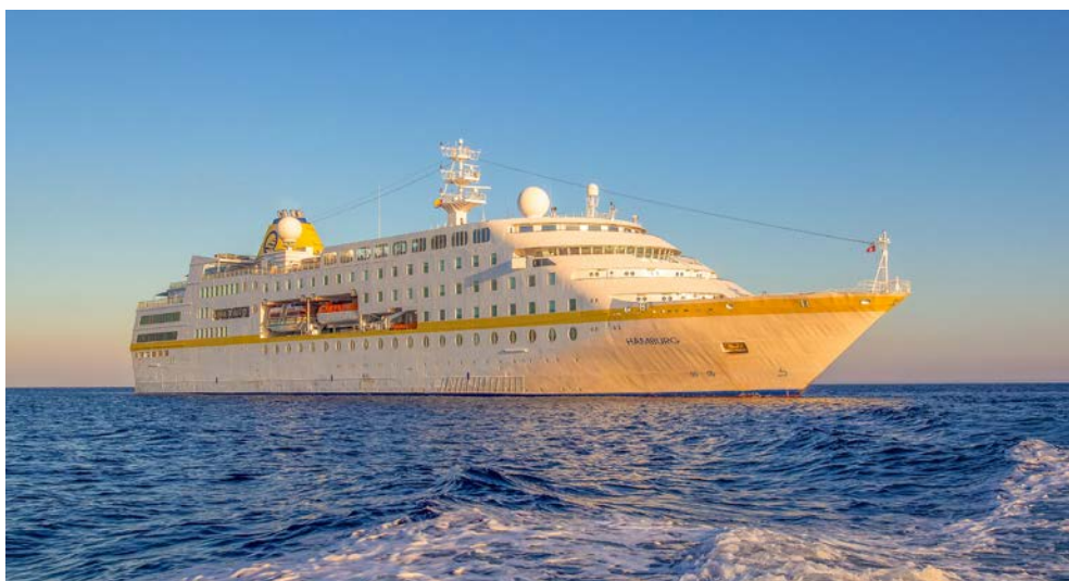
Ihr Schiff – die HAMBURG