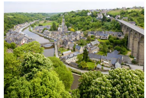
Ein Ausflug nach Quimper ist sehr zu empfehlen

Besuchen Sie in der Hafenstadt Brest zum Beispiel das Océanopolis, ein großes Aquarium und Meeresforschungszentrum, das Schloss von Brest, eine mittelalterliche Festung, die das Marinemuseum beherbergt oder den Tanguy-Turm, ein historischer Turm mit einem Museum über das alte Brest.