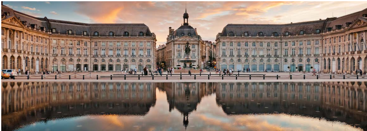
Bordeaux – Sie bleiben über Nacht