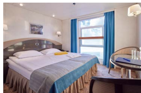
Kabinenbeispiel INFINITY Kabine