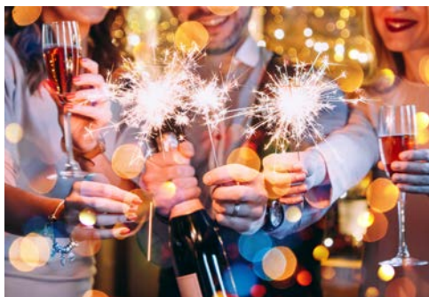
Stoßen Sie auf das neue Jahr an!

Entdecken Sie heute Vormittag den Ort Locarno bei einem geführten Stadtspaziergang. Politische