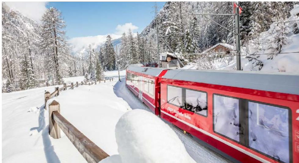
Der Bernina-Express fährt durch verschneite Landschaften

Seien Sie mit dabei, wenn Sie mit dem weltberühmten Bernina-Express auf den höchsten Bahngleisen Europas und den steilsten der Welt an spektakulären Kunstbauten wie dem Landwasserviadukt, hinauf zum ewigen Eis der Gletscher und wieder hinab ins italienische Tirano fahren. Genießen Sie südländisches Flair bei einem Spaziergang durch die Gassen von Como und einen fantastischen Blick aus 715 m Höhe auf den Comer See. Lernen Sie das Palmenparadies am Lago Maggiore mit den Orten Locarno und Ascona kennen. Bestaunen Sie die zweitgrößte Kirche Italiens, den Mailänder Dom, und erleben Sie beim Flanieren durch die berühmte Galleria Vittorio Emanuele II. das Gefühl des „Dolce far niente“. Der Jahreswechsel 2024/2025 am herrlichen Luganer See rundet die Reise ab.