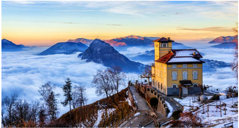
Mystische Stimmung – der Luganer See unter Wolken

Zusätzlich nur vorab buchbar: Ausflug Mailand € 79,-