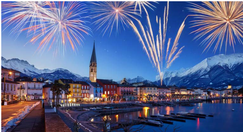
Neujahrsfeuerwerk in Ascona