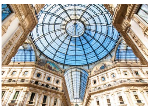
Galleria Vittorio Emanuele II.

Bei einem gemeinsamen Abendessen im Hotel lassen Sie den Tag ausklingen.