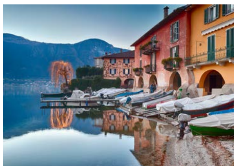
Italienischer Charme am winterlichen Comer See

Bekanntheit erlangte Locarno im Oktober 1925 durch die Unterzeichnung der Locarno-Verträge. Entdecken Sie die schmalen Gassen der Altstadt mit ihren stattlichen ehemaligen Adelsitzen, das historische Zentrum, dessen Mittelpunkt die kopfsteingepflasterte Piazza Grande ist. Einmal im Jahr, im August, werden die bunten Bürgerhäuser zur schönsten Filmkulisse der Welt anlässlich der Filmfestspiele von Locarno. Nach einer Mittagspause erkunden Sie das ehemalige mondäne Fischerdorf Ascona auf einem geführten Rundgang. Beginnend an der langgestreckten von Platanen überdachten Piazza Giuseppe Motta – hier gilt „Sehen und gesehen werden“, schlendern Sie durch den Borgo, die Altstadt, mit seinen engen, malerischen Gassen, die einen mediterranen Flair versprühen, vorbei an Galerien und Boutiquen. Um 1900 wurde das Fischerörtchen von Intellektuellen, wie Schriftsteller, Maler und zivilisationsmüden Nordländern aufgesucht und 1960 war der Ferienort so beliebt, das eine deutsche Autoserie nach ihr benannt wurde, der Opel Ascona. Höhepunkt des Abends ist der Besuch des großen Neujahrsfeuerwerk in Ascona. Rückkehr nach Lugano und gemeinsames Abendessen.