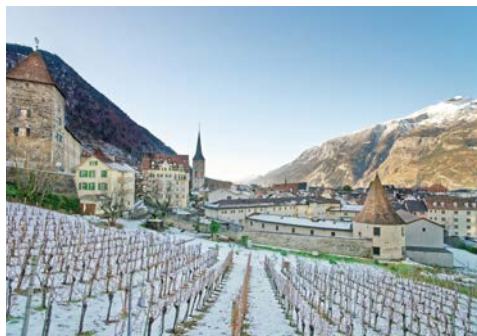
Blick auf Chur

Nach der Ankunft am Flughafen Zürich Empfang durch Ihre örtliche Reiseleitung. Weiterfahrt per Bus nach Chur, der Kantonshauptstadt Graubündens. Auf einem geführten Stadtsparziergang lernen Sie die älteste Stadt der Schweiz kennen. Nachdem Sie in Chur Ihr Hotel für die nächste Nacht bezogen haben, erwartet Sie ein gemeinsames Abendessen.