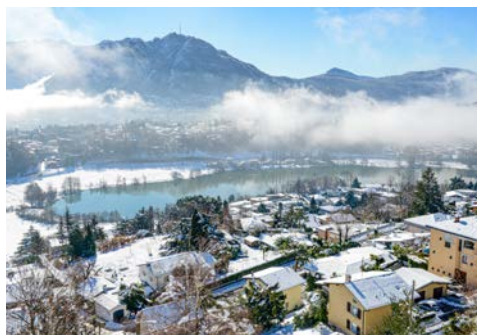
Lago di Muzzano in Lugano mit Blick auf Montagnola

Freuen Sie sich auf die imposante Zugfahrt im berühmten Bernina-Express von Chur nach Tirano. Durch wildromantische Schluchten, vorbei an spektakulären Kunstbauten wie dem Landwasserviadukt, hinauf zum ewigen Eis der Gletscher und wieder hinab bis zu den Palmen im italienischen Tirano. Sie erleben bequem die höchste Bahnstrecke über die Alpen, die den Norden Europas mit dem Süden verbindet und zusammen mit der Landschaft ein