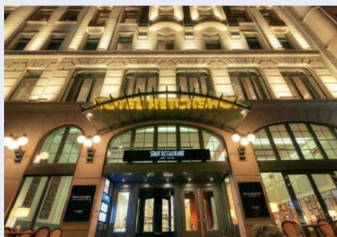
Hotel Reichshof Hamburg

Das Hotel Reichshof Hamburg gehört zu den traditionsreichsten Häusern der Stadt und verfügt über eine beeindruckende, teilweise denkmalgeschützte Einrichtung, in der Geschichte und Tradition auf Moderne treffen. Die 278 Zimmer bieten einen erholsamen Rückzugsort. Zu den Annehmlichkeiten gehören kostenloses WLAN, SuitePad, Safe, Tee- und Kaffeezubereiter, Bügeleisen, beleuchteter Kosmetikspiegel und Regendusche. Das Hotel verfügt auch über einen 250 m 2 großen Fitness und Wellnessbereich mit 2 Saunen und einer exklusiven Ruhelounge (gegen einen Aufpreis). Von dem 170 m entfernten Hauptbahnhof Hamburg erreichen Sie bequem die vielen verschiedenen Teile der Stadt. Die Haupteinkaufsmeile Mönckebergstraße liegt 500 m entfernt, und die Alster sowie das Rathaus von Hamburg erreichen Sie innerhalb von 15 Gehminuten.