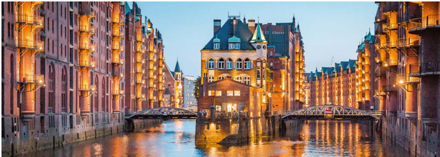
Blick auf die Speicherstadt