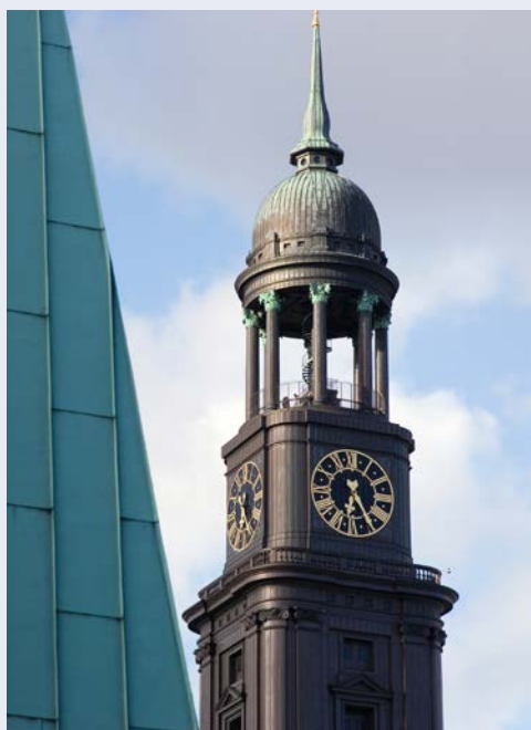
Kirchturm der Hauptkirche St. Michaelis

Im Anschluss geht es zurück ins Hotel, bevor Sie um 16.30 Uhr wieder abgeholt werden und ab 17 Uhr in einem schönen Restaurant beim frühen Abendessen den Blick auf den beleuchteten Hafen genießen. Von hier aus gehen Sie anschließend gemeinsam zur Elbphilharmonie. Auf dem Sockel des ehemaligen Kaiserspeichers an der westlichen Spitze der Hafencity erhebt sich der gläserne Neubau mit seiner kühn geschwungenen Dachlandschaft. Er birgt zwei Konzertsäle, ein Hotel und Appartements. Im Großen Saal des Konzerthauses erleben Sie dann ab 20 Uhr Christoph Willibald Glucks grandiose Oper „Orfeo ed Euridice“ mit dem Weltstar Cecilia Bartoli. Die Sängerin besitzt eine geradezu magnetische Bühnenpräsenz und ein Charisma, das nicht nur Klassikfans