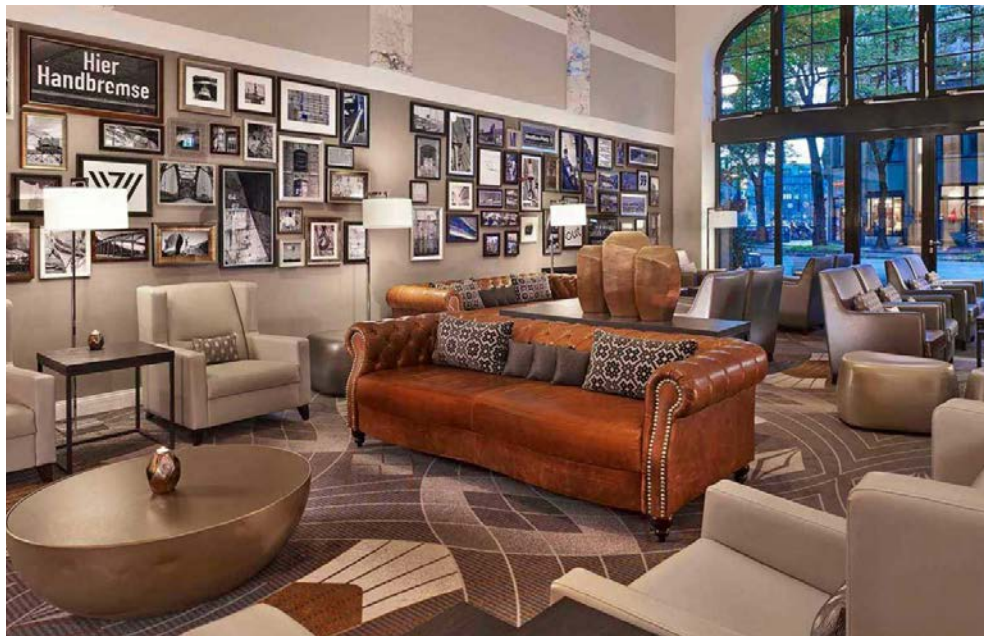
Lounge im Hotel