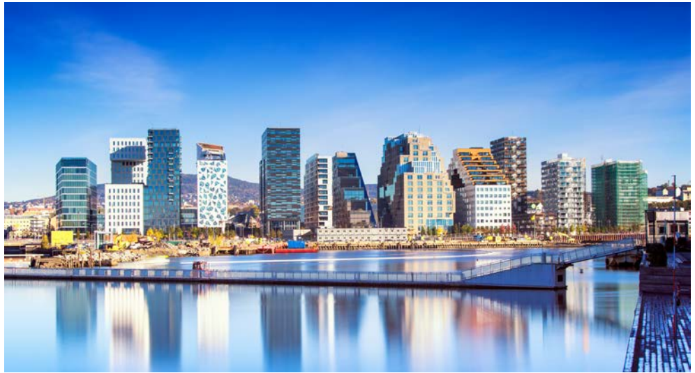
Willkommen in Oslo