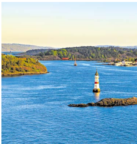
Der idyllische Oslofjord

Ein weiterer Höhepunkt ist der Besuch inklusive Führung im Astrup Fearnley Museum – das Zuhause der Astrup Fearnley Sammlung, einer Sammlung moderner und zeitgenössischer Kunst, die zu den bedeutendsten ihrer Art in Nordeuropa zählt. Im Mittelpunkt steht der Erwerb individueller, innovativer Werke. Ursprünglich dominierten junge amerikanische Künstler, aber nun gehören auch bedeutende Künstler aus Europa, Brasilien, Japan, China und Indien dazu. Wechselnde Ausstellungen ergänzen die Werke der festen Sammlung des Museums. Das Museumsgebäude von 2012 wurde vom italienischen Architekten Renzo Piano entworfen, der für Meisterwerke wie das Centre Georges Pompidou, das Auditorium Parco della Musica und das New York Times Building bekannt ist. Es besteht aus drei Pavillons unter einem markanten Glasdach in Form eines Segels. Das Astrup Fearnley Museum ist vom