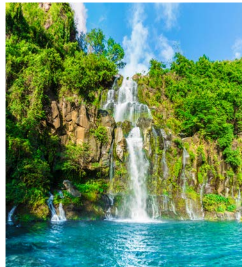
La Réunion – Basins of Aigrettes

Nach der Ausschiffung empfängt Sie Ihr deutschsprachiger Reiseleiter am Hafen von Port Louis zu einer ganztägigen Tour in einem klimatisierten Reisebus. Zunächst fahren Sie in die bezaubernde Stadt Mahébourg. Die einzigartige Mischung aus historischen Gebäuden, Denkmälern und authentischen kreolischen Häusern verleihen der Altstadt ein folkloristisches Ambiente. Folgen Sie Ihrem Reiseleiter zu einem Besuch des Marinemuseums, in dem viele Relikte der historischen Seeschlacht zwischen