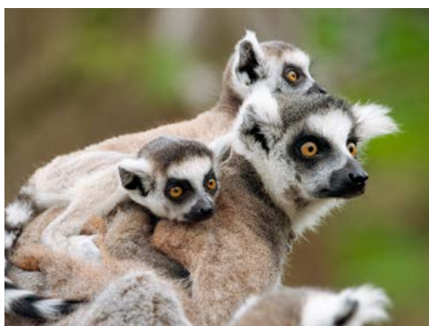
Lemuren auf Madagaskar

Lassen Sie sich an Bord in der Weinbar der Michael-Mondavi-Familie mit wohlschmeckenden Weinen verwöhnen. Spielen Sie Ihre Glückssträhne im Casino aus, oder besuchen Sie die O'Sheehan's Neighborhood Bar & Grill.