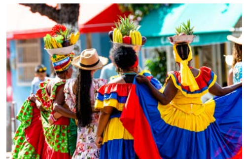
Palenqueras Frauen in Cartagena

Cartagena, eine der schönsten Kolonialstädte Südamerikas, empfängt Sie mit dem hippen Viertel Getsemani. Entdecken Sie die vielen Bars und Restaurants und die farbenfrohen Wandmalereien. Das komplett vom Festungsring ummauerte alte Stadtzentrum sowie die Kathedrale und das Viertel der kleinen Händler, San Diego, gehören seit 1984 zum UNESCO-Weltkulturerbe.