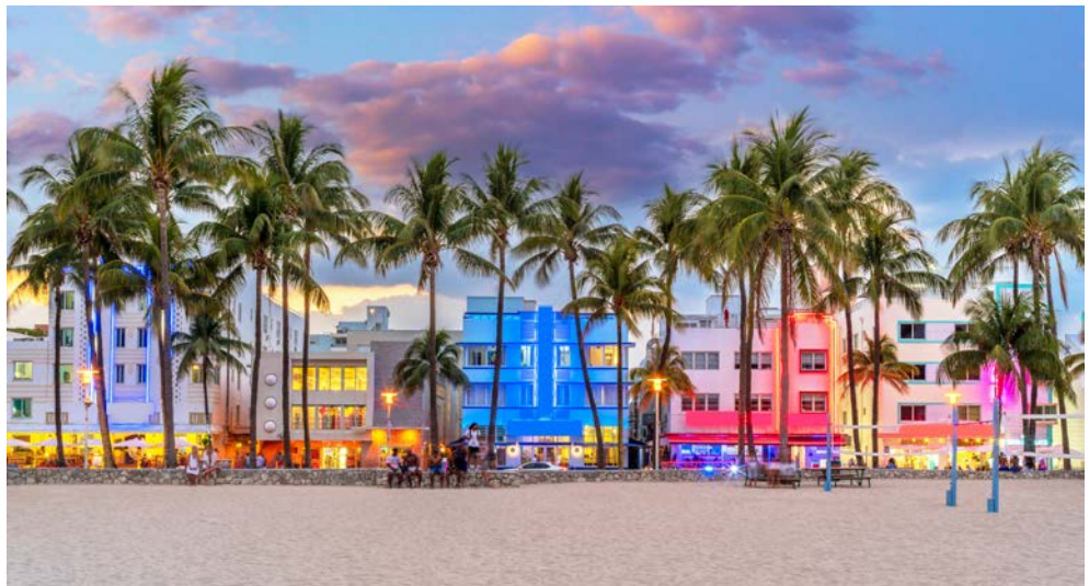
Vielleicht besuchen Sie Miami South Beach?