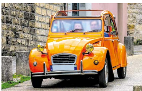
Authentisch unterwegs mit dem 2CV