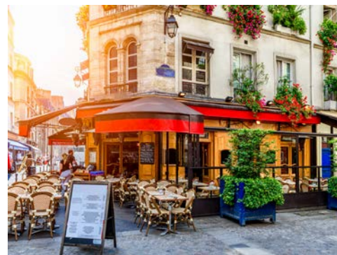
Gehört zu Paris wie der Eiffelturm – ein „petit-déjeuner“

Heute ist Ihre ereignisreiche Reise leider schon zu Ende – „Au revoir Paris“! Begleitung zum Flughafen und Rückflug nach Deutschland