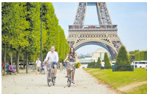
Mit dem Fahrrad unterwegs

Den Tag starten Sie mit einer etwas anderen Tour durch Paris – steigen Sie auf ein Fahrrad und erkunden Sie die Stadt! Auf dieser geführten Tour entdecken Sie weitere Highlights von Paris entlang der Seine, die zum UNESCO-Weltkulturerbe gehört. Erleben Sie Geschichte, Kultur und Romantik entlang der legendären Flussufer der berühmten Stadt. Sie beginnen Ihre Tour am rechten Seine-Ufer, passieren die Pont Marie Brücke und entdecken Paris durch seine Seitenstraßen und Brücken. Bei mehreren Stopps auf den prestigeträchtigen Brücken zeigt Ihnen Ihr Reiseleiter die schönsten Perspektiven auf beeindruckende Monumente!