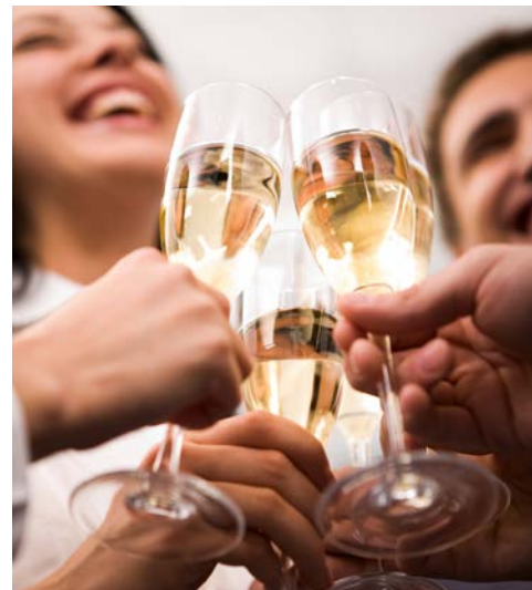
Auf eine gelungene Reise!