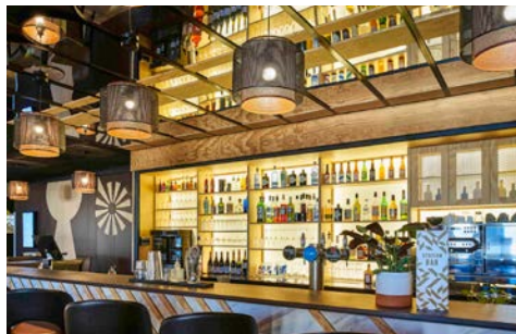
Stationbar im Hotel