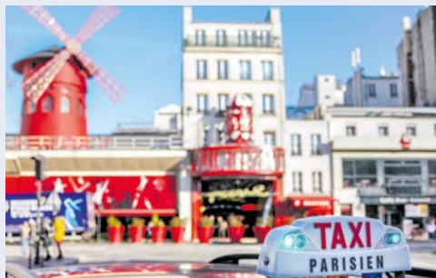
Das berühmte Moulin Rouge

Wie wäre es am Abend mit einem Besuch der berühmten Comedy Show über die Eigenheiten, Besonderheiten und unausgesprochenen Verhaltensregeln der Pariser? Nach der Show „How to become a Parisian in one hour“ werden Sie während Ihres Aufenthaltes wie ein echter Pariser handeln. Sie werden sowohl die typische Pariser Sprache als auch die Gesichtsausdrücke lernen und viel lachen (Hinweis: einfaches Schulenglisch ist ausreichend, um die Show zu verstehen, da viel mit Mimik und Klischees