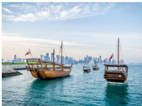
Stiliche Dhows vor der Skyline in Doha

Eine Hauptattraktionen der Stadt Doha ist die kilometerlange Promenade (Corinche) am Wasser. Sie können die gesamte Corinche entlang schlendern bis zum futuristischen Viertel West Bay, in dem sich Architekten gegenseitig mit außergewöhnlichen Wolkenkratzern übertrumpfen wollen. An der Corinche sind einige der schönsten Museen von Katar angesiedelt, die nicht nur Kulturfreunde in ihren Bann ziehen. Zum Beispiel das 2008 eröffnete Museum für Islamische Kunst des bekannten Architekten I. M. Pei besticht schon von außen durch seine ungewöhnliche, sandsteinfarbene Gestalt. Im Inneren beherbergt es die Kunstschatze der Emire von Katar und spiegelt über 1.000 Jahre Kulturgeschichte der arabischen Region wider.