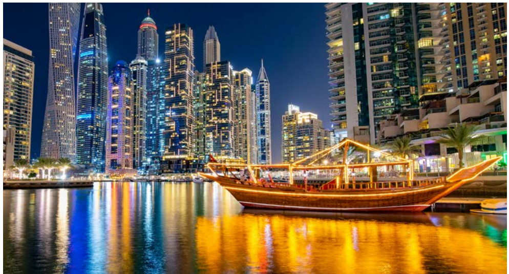
Abendliches Dubai - eine Dhow im Hafen Marina Bay