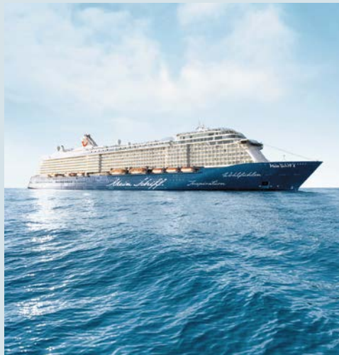
Die Mein Schiff 4