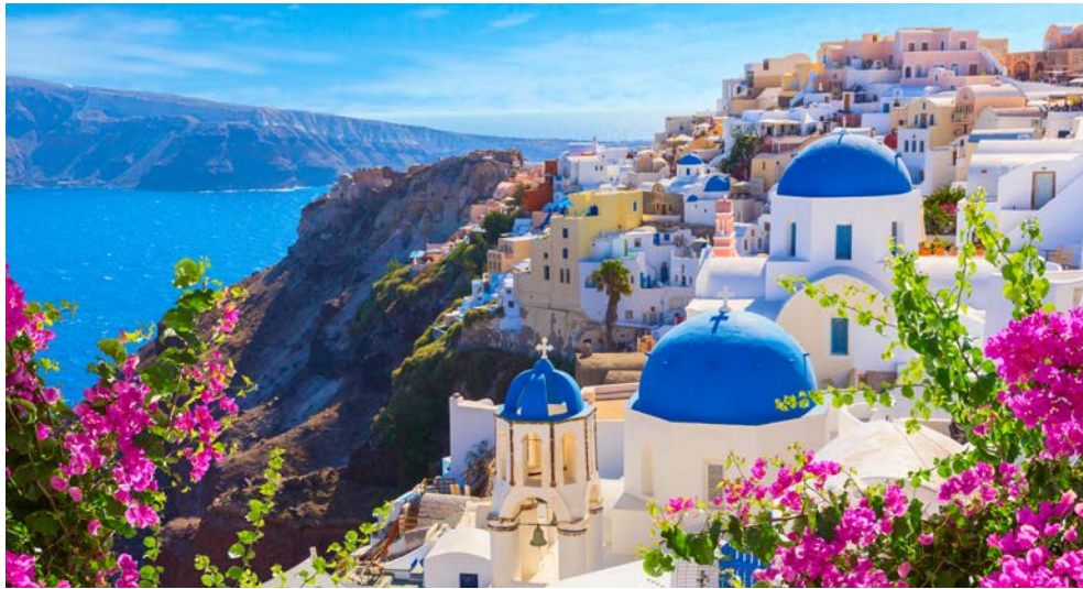
Einen traumhaften Blick genießen auf Santorin