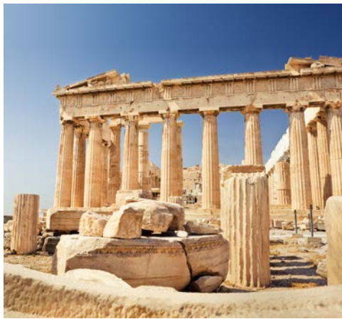
Akropolis in Athen