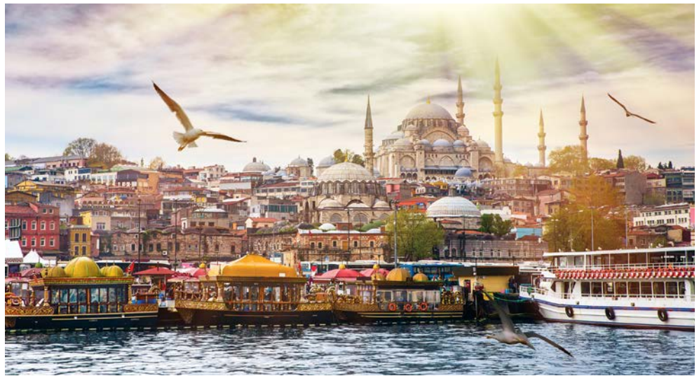
Bosporus – die Meerenge zwischen Europa und Asien