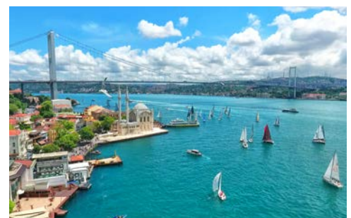
Blick auf den Bosporus

Heute wartet ein weiteres tolles Ausflugsprogramm auf Sie (falls gebucht). Sie starten am Topkapi-Palast. Er war einst die opulente Residenz der Sultane und bietet eine faszinierende Mischung aus architektonischer Brillanz, kulturellen Schätzen und Geschichten. Genießen Sie den Ausblick bei einer Fahrt entlang des Goldenen Horns, einem natürlichen Hafen, der die Altstadt von Istanbul umgibt. Bewundern Sie die historischen Stadtmauern aus dem 5. Jahrhundert, die die Stadt einst schützten. Nach einer Fahrt auf den Piere Loti Hügel genießen Sie den atemberaubenden Blick auf das Goldene Horn und die Altstadt. Nach einer Mittagspause geht es weiter zur Eyüp Moschee am Goldenen Horn. Sie ist ein wichtiger Ort für Gläubige. Erleben Sie am Ende eine unvergessliche Bootsfahrt auf dem Bosporus, während Sie zwischen zwei Kontinenten schweben und die beeindruckende Skyline von Istanbul bewundern. Anschließend geht es für Sie zurück zum Hotel.