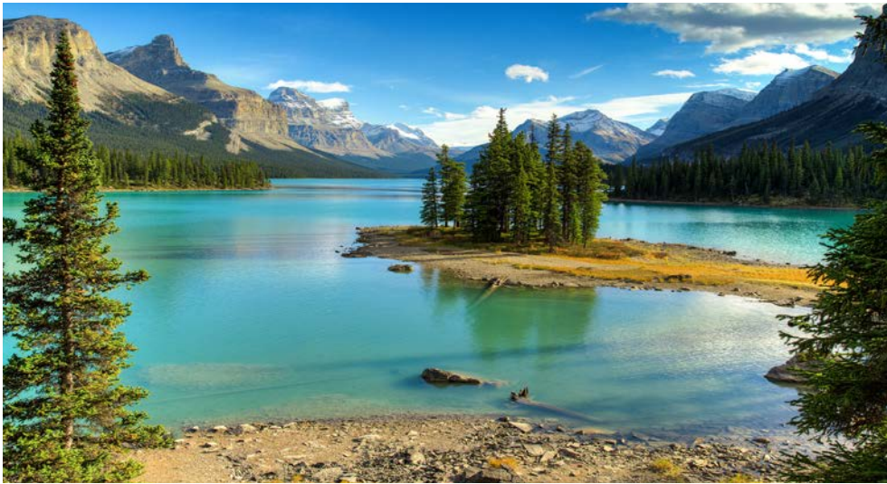
Spirit Island im Jasper Nationalpark