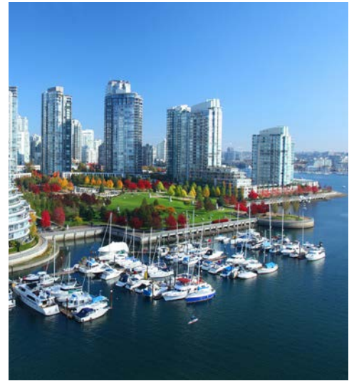
Die Skyline Vancouvers