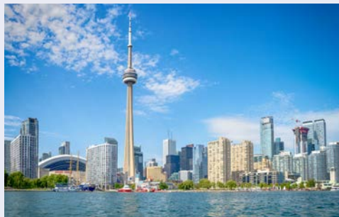
Skyline von Toronto