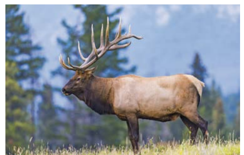
Wapiti im Banff Nationalpark.

Während der 4-stündigen Busfahrt über den Icefields Parkway erwarten Sie eine atemberaubende Flora und Fauna. Die Gletscher des Columbia Icefields erleben Sie vom Aussichtspunkt Glacier Skywalk. Besonders Mutige wagen sich auf die gläserne Aussichtsplattform, von der Ihnen die Tierwelt der Rockies buchstäblich zu Füßen liegt. In Banff, dem berühmten Hauptort des gleichnamigen Nationalparks, beziehen Sie im Komfort-Hotel Ihr Zimmer für die folgenden drei Nächte. Im Hotel erwartet Sie Ihr Dinner in wunderbarem Ambiente. (F/A)