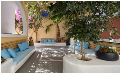
Innenhof Ihres Blue Sea Hotels

Die 37 Bungalows sind helle Rückzugsorte und alle im traditionellen kykladischen Baustil gebaut und eingerichtet, in perfekter Harmonie mit der Insel Landschaft. Jedes Zimmer verfügt über eine Reihe von Annehmlichkeiten, darunter Flachbildfernseher, Satellitenkanäle, individuell regulierbare Klimaanlage, Kühlschrank, W-LAN, sowie eine eigene Terrasse oder Balkon mit Meerblick. Von der Poolbar und Restaurant aus genießen Sie einen fantastischen Blick auf das Meer und die Inseln Naxos und Ios.