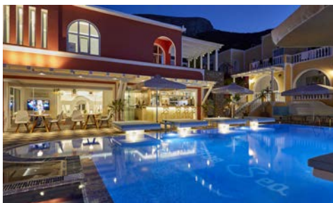
Pool Ihres Blue Sea Hotels