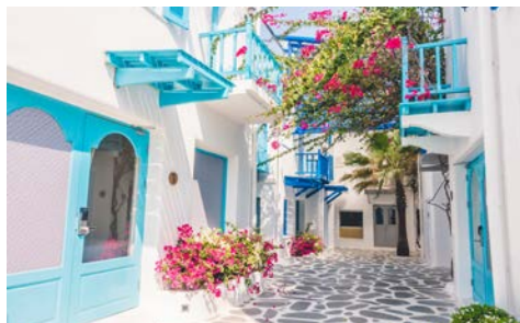
Zauberhafte Gassen auf Santorin

Ihre Reise beginnt mit dem Flug nach Santorin. Die einzigartige vulkanische Landschaft der griechischen Insel Santorin ist ein ganz besonderes Ziel. Schwarzrote Strände und kleine, verschlafene Orte, die sich in 300 m Höhe an einen Fels hang schmiegen, prägen das Bild der Insel. Am Flughafen werden Sie von Ihrer örtlichen, Deutsch sprechenden Reiseleitung empfangen und zu Ihrem Hotel begleitet. Abendessen in einer Taverne. (A)