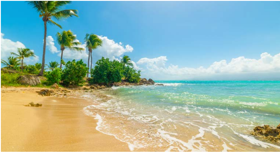
Guadeloupe ist Karibik pur.

Chavón-Fluss bis hin zum Karibischen Meer. Von hier aus empfehlen sich Ausflüge zu den umliegenden paradiesischen Trauminseln. Die Isla Saona oder die Isla Catalina werden Sie gewiss verzaubern.