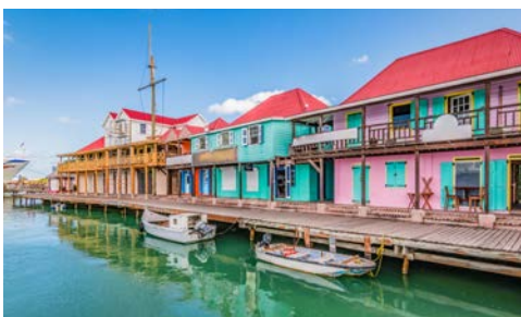
Der Hafen in Saint John's

St. Maarten ist aufgeteilt in einen niederländischen und einen französischen Inselteil. Das niederländische Philipsburg besticht durch pastellfarbene Häuschen, enge Gassen, eine hübsche Uferpromenade und einen Hauch Kolonialzeit. Besuchen Sie das Fort Amsterdam und tauchen Sie ein in die Geschichte der ersten europäischen Siedler auf der Insel. Savoir-vivre finden Sie dann in Marigot, der Hauptstadt des französischen Teils: Extravagante Geschäfte und feine Küche – was will man mehr?