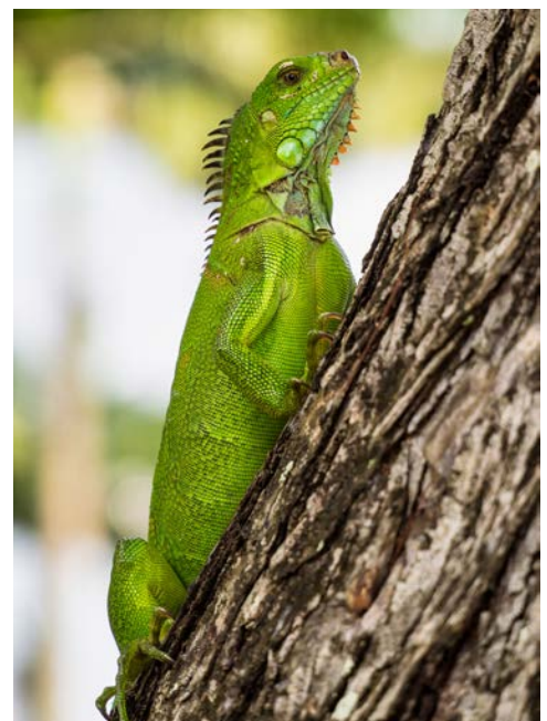
Grüner Leguan in Martinique