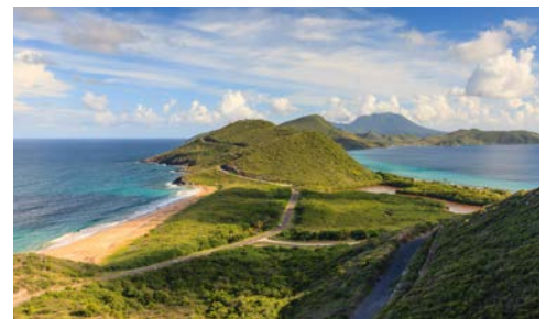
St. Kitts and Nevis

Nutzen Sie die freien Tage, um etwas Sport zu treiben oder während einer Yoga-Stunde einen freien Kopf zu bekommen. Mit dem vielfältigen Sportangebot haben Sie die Möglichkeit ganz individuell nach Ihren Wünschen zu trainieren.