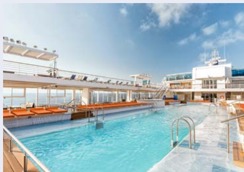
Toller Pool an Bord