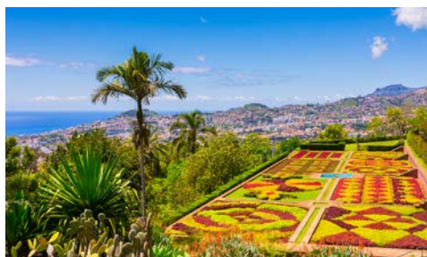
Der Botanische Garten auf Madeira

Wie schön, dass Ihre Kreuzfahrt mit Seetagen beginnt. Lernen Sie Ihr Schiff in Ruhe kennen – vielleicht buchen Sie u.a. einen entspannten Wellnessstag im SPA & Meer-Bereich und lassen sich mal so richtig verwöhnen!