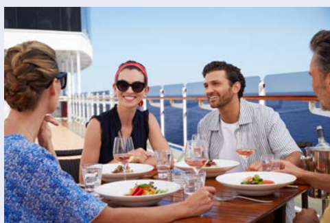
Willkommen an Bord