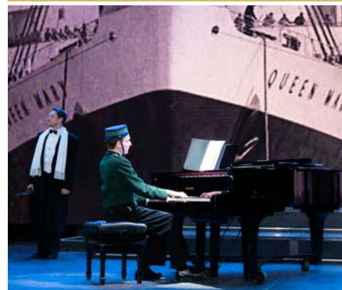
Die Royal Shakespeare Company

Die Royal Shakespeare Company (RSC) wurde von Peter Hall im Jahr 1961 gegründet und hat sich mit Darbietungen von Werken Shakespeares und seiner Zeitgenossen in Großbritannien und der ganzen Welt einen Namen gemacht. Auf diesen besonderen Kreuzfahrten können Sie sich auf exklusive Theaterszenen und klassische Darbietungen auf der Bühne und auf der Leinwand freuen sowie an Workshops und Fragerunden teilnehmen.