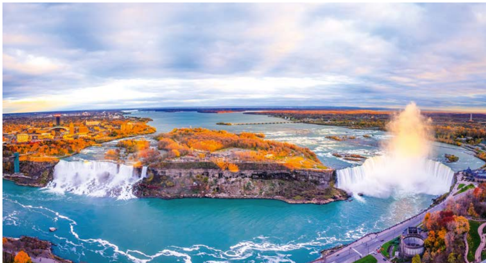
Majestätisch – die Niagara-Fälle