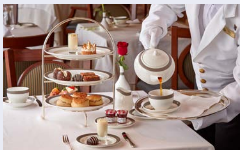
Erstklassiger Service an Bord