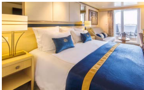
Balkonkabine – Beispiel

Einen detaillierten Decksplan, Informationen zum Schiff erhalten Sie im Internet unter der unten angegebenen Adresse.