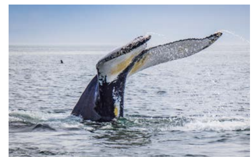
Mit etwas Glück sehen Sie Wale

Als die Europäer hier ankamen, nannten sie den Ort nach den sieben Inseln, die vor der Küste eine kleine Inselgruppe bildeten. Zwei von diesen sind jetzt Vogelschutzgebiete, wo Tordalken, atlantische Papageientaucher, Alken und Gryllteiste zu den Bewohnern und regelmäßigen Besuchern gehören. Der Golf von St. Lawrence ist auch ein Ort, um die großen Säugetiere des Ozeans zu sehen: Zergwale, Buckelwale und Schwertwale gehören zu den 13 häufigsten hier vorkommenden Arten.