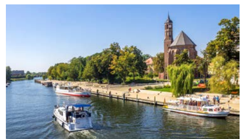
Brandenburg a.d. Havel