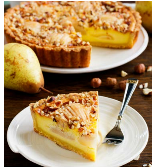
Kaffeepause mit Birnenkuchen