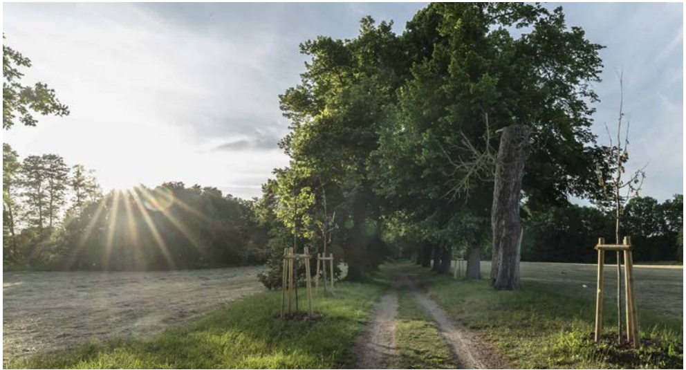
Wanderweg nahe des Hotels

ab/bis Oldenburg ohne Aufpreis inkl. Busfahrt vom ZOB Oldenburg nach Lehnin und zurück