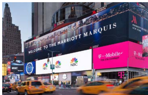
Das New York Marriott Marquis liegt „mittendrin“

Erleben Sie die lebendige Atmosphäre Manhattans im neu renovierten New York Marriott Marquis direkt am Times Square. Das Haus bietet eine perfekte Anbindung zu den Sehenswürdigkeiten der Stadt. Gönnen Sie sich herzhaftes New Yorker Gerichte dank der innovativen Speisekarte in den neu gestalteten Restaurants, zu denen auch der einzige rotierende Speiseraum der Stadt mit Rundumblick auf Manhattan zählt. Entspannen Sie sich in den geräumigen Zimmern, die mit modernen Annehmlichkeiten und einem atemberaubenden Blick auf den Broadway und den Times Square begeistern.