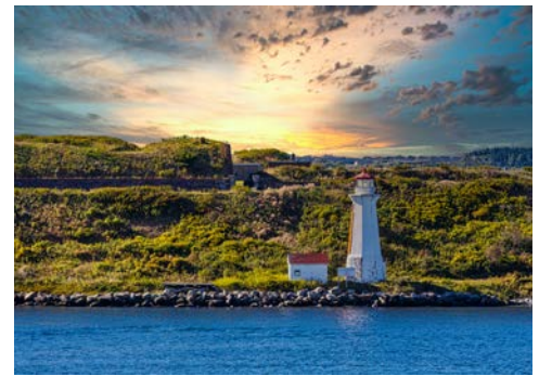
Georges Island Lighthouse in der Bucht von Halifax

Es gibt so viele Bars und Lounges an Bord, dass es ein paar Tage dauern kann, bis Sie Ihren Favoriten gefunden haben. Ganz gleich, ob Sie sich mit Freunden