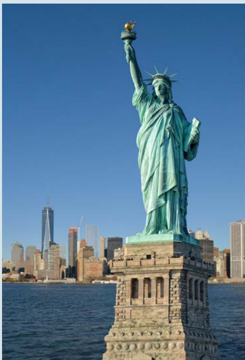
Freiheitsstatue vor Manhattan

Die älteste Stadt Kanadas besticht durch ihre Freundlichkeit – und überwältigende Aussichten! Unternehmen Sie eine Kajakfahrt, beobachten Sie Wale oder schlendern Sie durch die George Street mit ihren zahlreichen Bars und Restaurants. Auch die Preiselbeer-Muffins (eine Spezialität Neufundlands) und die nationalhistorische Stätte Cape Spear sollten Sie sich nicht entgehen lassen.