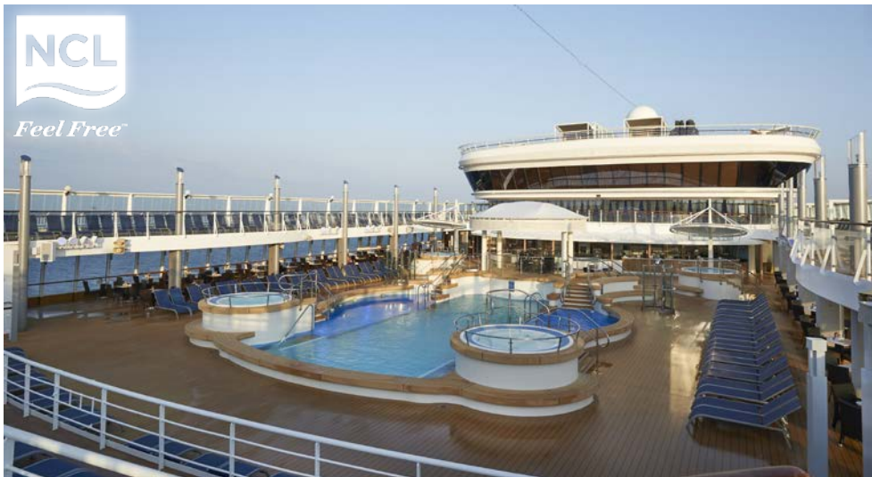
Auf dem Pooldeck der NORWEGIAN STAR