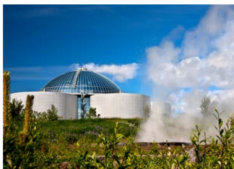
Futuristisch – das Perlan Museum in Reykjavik

Island gilt nicht umsonst als das Traumziel eines jeden Fotografen. Die fantastische Landschaft hält Ausblicke auf Lavaströme, heiße Quellen und unberührte Natur bereit. Inmitten dieser unglaublichen Umgebung liegt Reykjavik, die nördlichste Hauptstadt Europas. Nach der Ausschiffung unternehmen Sie eine Stadtrundfahrt, die Ihnen die wichtigsten Sehenswürdigkeiten der Stadt nahe bringt. Dabei besuchen Sie auch die Aussichtsplattform auf dem Reykjavik Perlan Museum. Schon das Gebäude selbst ist unglaublich – ein futuristisches Meisterwerk. Von oben genießen Sie einen spektakulären 360-Grad-Blick auf Reykjavik, die Halbinsel Reykjanes und den Snæfellsjökull-Gletscher. Danach laden wir Sie zum Mittagessen im beliebten Brauhaus Bryggjans