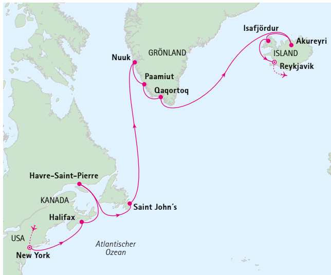
Ihre grandiose Reiseroute