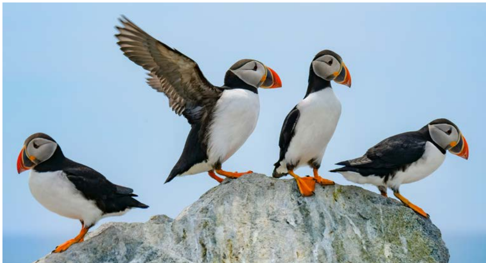
Die niedlichen Papageientaucher „wohnen“ sowohl in Grönland als auch in Island