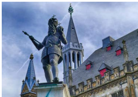
An Karl dem Großen kommen Sie in Aachen nicht vorbei

Es bleibt noch Zeit und die Möglichkeit, den Dom von innen zu besichtigen, bevor es auf den Weihnachtsmarkt geht. Er findet vor der Kulisse des historischen Rathauses und in den umliegenden Gassen statt. Aufgrund seines stimmungsvollen Ambientes ist er sehr beliebt und zieht die Aachener Bürger und Freunde