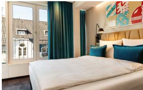
Zimmerbeispiel im Hotel

Das Motel One Aachen liegt zentral in der alten Kaiserstadt. Verschiedene Aachener Sehenswürdigkeiten wie der Aachener Dom, das historische Rathaus, das Theater und der stimmungsvolle Weihnachtsmarkt sind zu Fuß erreichbar. Jedes Zimmer des Hotels verfügt über einen Schreibtisch, einen Flachbild-Fernseher, ein Bad, Haartrockner sowie einen eigenen Safe. WLAN wird im kompletten Hotel kostenfrei angeboten.