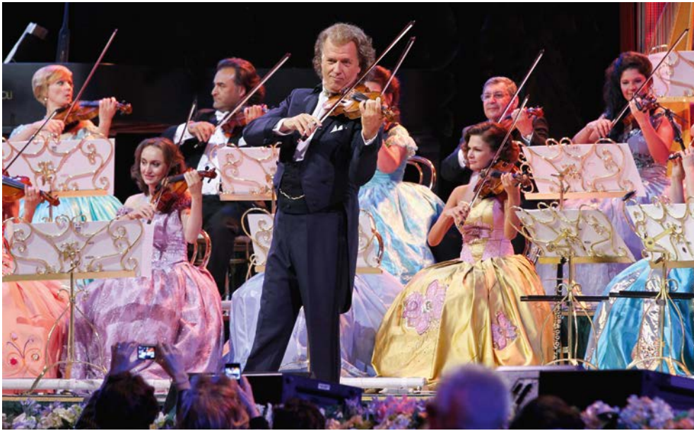
Ein fantastisches Erlebnis – das Weihnachtskonzert von und mit André Rieu