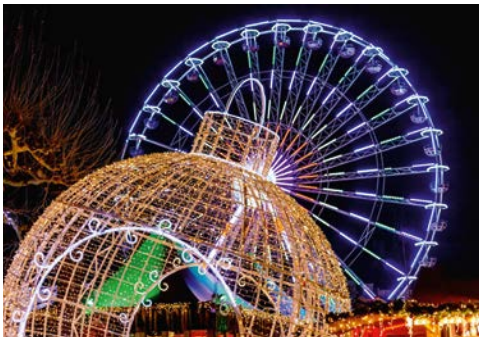
Weihnachtliche Impressionen in Maastricht

durch die geschmückte Innenstadt und lassen Sie sich durch enge Gassen treiben. Um 13.00 Uhr treffen Sie sich wieder im Hotel und die Fahrt geht in die benachbarten Niederlande ins nahe gelegene Maastricht. Unterwegs wird Ihnen Ihre Gästeführerin schon einiges zur Geschichte und den Besonderheiten Maastrichts erzählen. Angekommen, werden Sie sich mit Ihrer Gästeführerin gemeinsam auf einen Stadtrundgang begeben und sich vom vorweihnachtlichen Flair der niederländischen Stadt verzaubern lassen. Anschließend haben Sie die Möglichkeit, über den Weihnachtsmarkt zu flanieren, welcher mit dem Duft nach Krapfen, Waffeln und Maronen Kindheits-erinnerungen weckt. Stimmungsvoll illuminierte Straßen verbinden die Plätze und Höfe der historischen Innenstadt und sicherlich finden Sie hier noch ein paar Weihnachtsgeschenke, bevor Sie ein gemeinsames Abendessen gegen 17.15 Uhr einnehmen. Im Anschluss erleben Sie einen märchenhaften und unvergesslichen Abend mit dem Walzerkönig. Bereits wenn Sie den traumhaften Saal betreten, wird Sie eine Landschaft wie aus einem Wintermärchen in Weihnachtsstimmung versetzen.