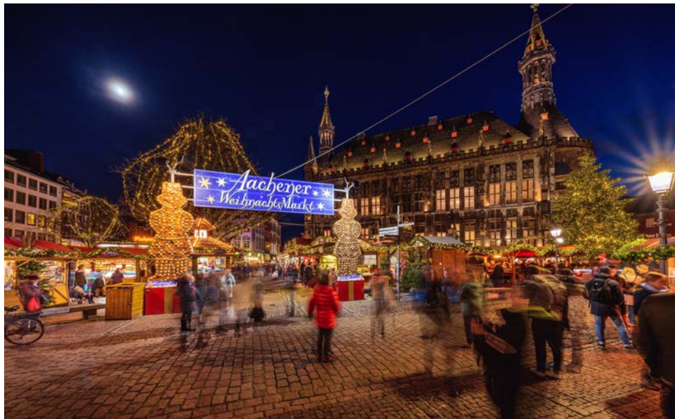
Weihnachtsmarkt in Aachen mit Blick auf das Rathaus

André Rieu ist ein musikalischer Superstar: weltweit als „Walzerkönig“ gefeiert, gehört der niederländische Star-Violinist seit dreißig Jahren zu den erfolgreichsten internationalen Spitzenkünstlern. Der charismatische Weltstar begeistert seine Fans auf fünf Kontinenten mit der perfekten Mischung aus Walzer, Filmmusik, Musical, Oper und Schlager. Jährlich besuchen rund 600.000 Zuschauer seine humorvollen, romantischen und grandiosen Konzerte. Damit übertrifft Rieu weltbekannte Künstler wie Coldplay, Elton John oder Madonna. Erleben Sie André Rieu und sein Johann Strauss Orchester bei einem zauberhaften Weihnachtskonzert in seiner Heimatstadt Maastricht. Das Konzert „Christmas with André“ wird zweifellos eines der bezauberndsten Musikereignisse des Jahres und wird Sie kurz vor Heiligabend in Weihnachtsstimmung versetzen.