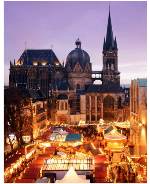
Festliche Atmosphäre in Aachen