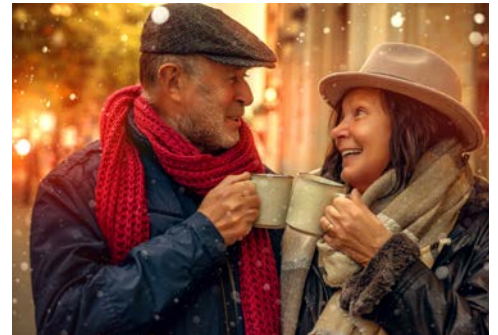
Stimmen Sie sich entspannt auf die Feiertage ein

Nach dem Frühstück und Check-Out besuchen Sie mit Ihrer Gästeführerin zum Abschluss um 11.00 Uhr das Historische Rathaus zu Aachen. Bereits an seiner Fassade lässt sich der Glanz des Gebäudes ablesen: 50 Herrscher, 31 davon in Aachen gekrönt, säumen die zentralen Figuren über dem Eingang des Rathauses: Karl der Große, Christus und Papst Leo III. Auch in den kunstvoll gestalteten Räumen wird die Geschichte des auf historischem Boden der Palastaula Karls des Großen errichteten Rathauses lebendig. Im Krönungssaal, wo einst die Herrscher nach ihrer Krönung das Mahl nahmen, erinnern heute noch Kopien der Reichskleinodien an die glanzvolle Zeit. Am 22. Januar 2019 unterzeichneten hier die ehemalige Bundeskanzlerin Angela Merkel und der französische Präsident Emmanuel Macron den Vertrag von Aachen, der eine Erneuerung der freundschaftlichen Beziehung zwischen Deutschland und Frankreich besiegelte. Gegen 13.00 Uhr treten Sie Ihre Heimreise an.