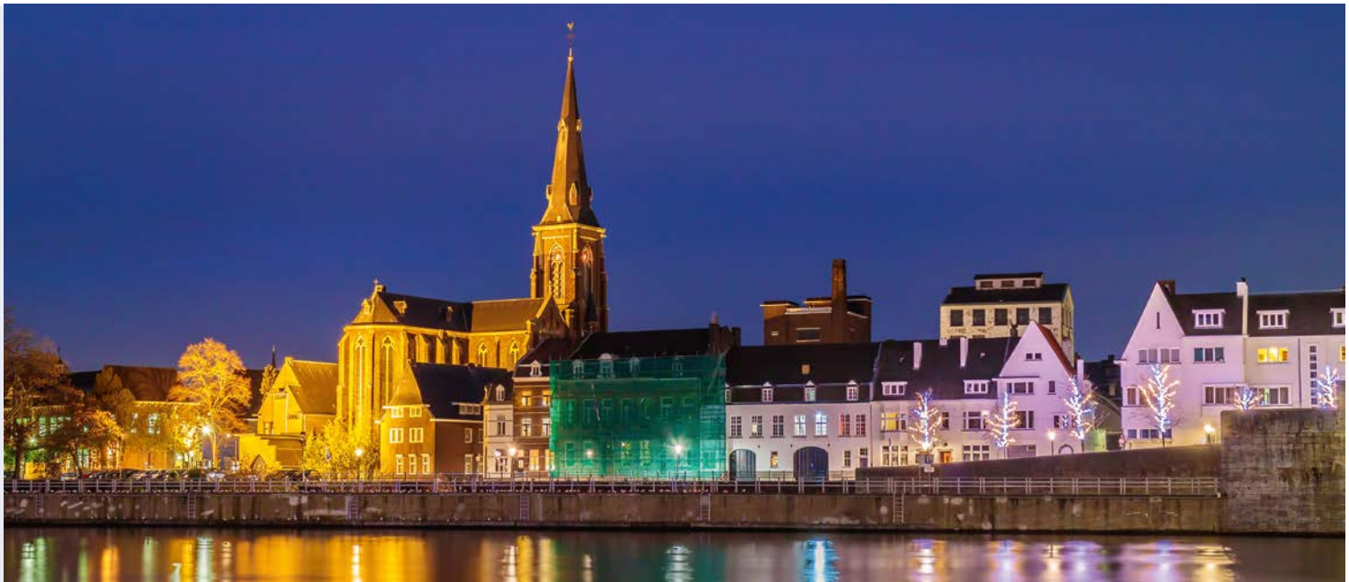
Stadt-Silhouette von Maastricht

Reisepreise pro Person: TM9770 im Doppelzimmer € 745,- im Doppelzimmer zur Alleinbenutzung € 875,-