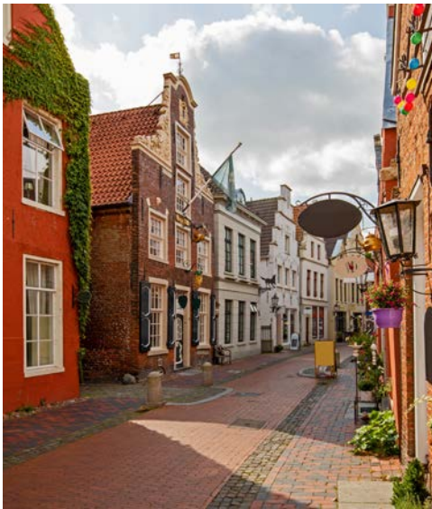
Leer in Ostfriesland

Wenn Sie mögen, unternehmen Sie heute einen Rundgang in Groningen, der Metropole der nördlichen Niederlande. Danach überqueren Sie die Meeresbucht Dollart, ein faszinierendes Vogelparadies, und gelangen ins ostfriesische Städtchen Leer.