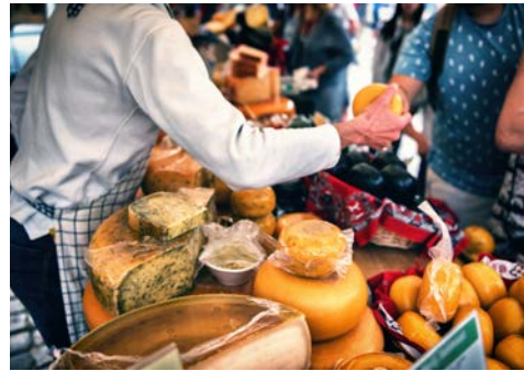
Käsemarkt in Alkmaar

2. Tag: Amsterdam – Alkmaar (Ausflugspaket) – Den Helder Am frühen Morgen heißt es „Leinen los!“. Erstes Ziel ist Zaanse Schans. Hier beginnt der Ausflug in das reizvolle und durch seinen Käsemarkt bekannte Alkmaar, wo ein gemütlicher Rundgang stattfindet, falls gebucht. Weiterfahrt Richtung Norden.