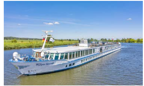
Die THURGAU SAXONIA

Einen detaillierten Deckplan und Informationen zum Schiff sowie zu technischen Hinweisen bei Flussschiffen erhalten Sie im Internet unter der unten angegebenen Adresse.