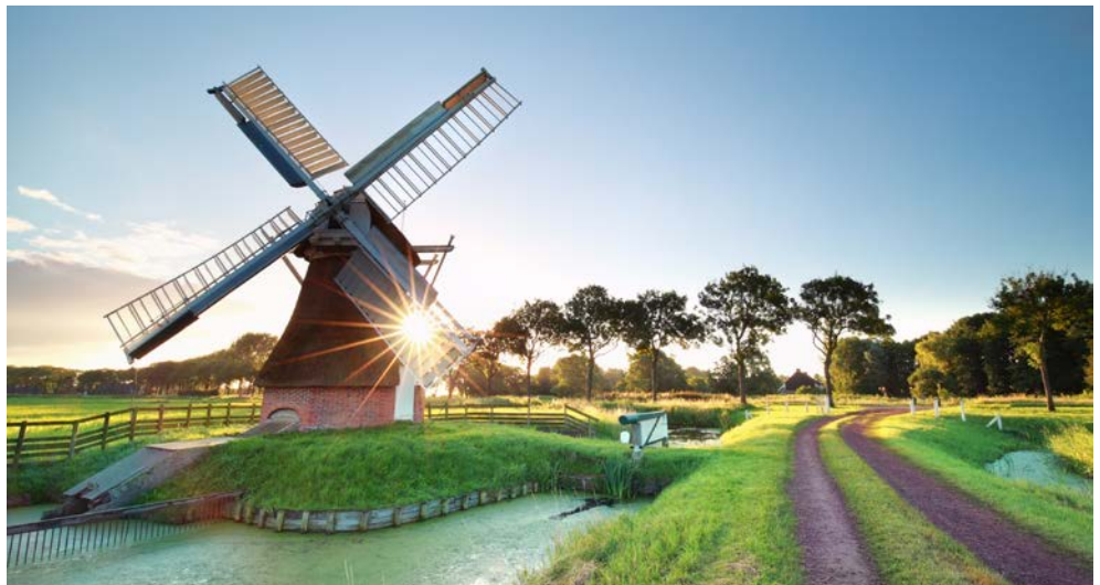
Wunderschöne Landschaften ziehen an Ihnen vorbei