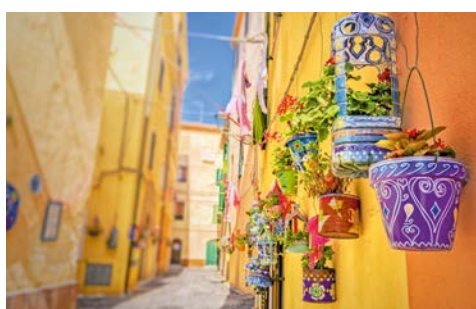
Charmante Altstadtgässchen in Alghero