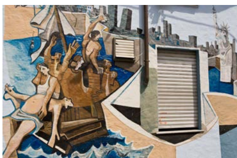
Die sogenannten „Murales“ in Orgosolo