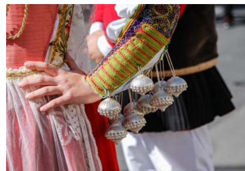
Typisch sardische Trachten

Alghero ist mit seiner malerischen Altstadt und dem eindrucksvollen Yachthafen ein echtes Schmuckstück. Der Katalanische Charme ist in „Barceloneta“ (kleines Barcelona) noch spürbar. Sie erkunden die altertümlichen Sehenswürdigkeiten der Stadt bei einem Rundgang und sehen u.a. den Dom Santa Maria und die schöne Kirche San Francesco. Im Anschluss haben Sie Zeit für einen Kaffee an der Uferpromenade, bevor Sie zum Hotel zurückfahren.