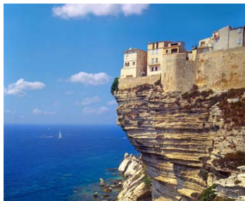
Bonifacio auf Korsika

Der heutige Tagesausflug führt Sie in das Kernland Sardinien. Morgens besuchen Sie zunächst das Trachtenmuseum in der Provinzhauptstadt Nuoro, mit der umfangreichsten Sammlung volkskundlicher Exponate Sardinien. Anschließend fahren Sie zum berühmten Gebirgsort Orgosolo, einst Heimat vieler Banditen aber auch von Künstlern. Bei einem Bummel durch den Ort sehen Sie „Murales“, Malereien an Hauswänden, die den politischen Widerstand und das soziale Engagement der Bewohner widerspiegeln. Danach erwartet Sie ein zünftiges Mittagessen mit sardischen Spezialitäten bei einem Hirten. Am Nachmittag Rückkehr zu Ihrem Hotel.