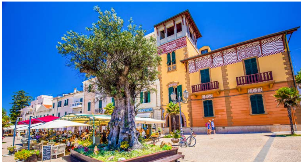
Die Altstadt von Alghero

Von der insgesamt 1.849 km langen Küste ist die 35 km lange Costa Smeralda im Nordosten, die Smaragdküste, die berühmteste. Die vielen weißen Sandbuchten mit ihren von Wind und Wetter ausgehöhlten Felsen und dem smaragd-farbenen Wasser werden von Gebirgsketten umrahmt. Sardinien hat eine jahrtausendelange Belagerungsgeschichte. Die Phönizier und Punier waren die Ersten, später fielen die Römer, die Byzantiner und Katalanen ein. Sie alle hinterließen ihre Spuren. Das inkludierte Ausflugspaket bringt Ihnen die verschiedenen Gesichter und die landschaftlichen Glanzpunkte näher. Ob die Costa Smeralda oder das Barbarenland mit den berühmten Wandmalereien „Murales“ – Sie werden viel zu entdecken haben!