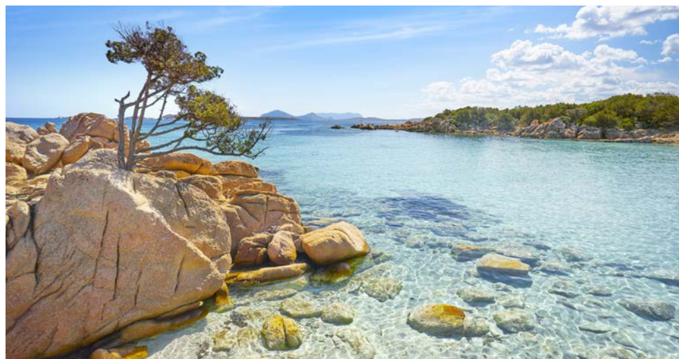
Die Costa Smeralda