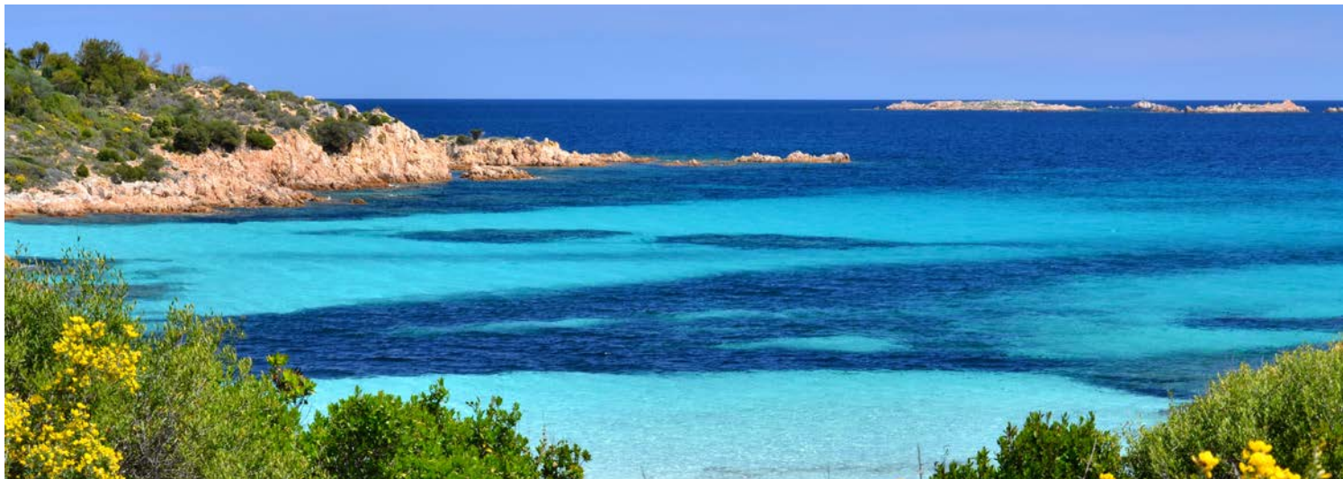
Traumhafte Küstenlandschaften erwarten Sie