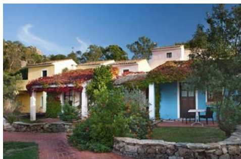
Mediterranes Flair im Hotel Airone

Das Hotel Airone (Landeskategorie: 4 Sterne) liegt ca. 800 m vom Strand entfernt – eingegliedert in einen großen Park mit Blick auf die Küste von Arzachena. Zu den Einrichtungen des Hotels zählen ein Restaurant mit großer Veranda und ein Außen- pool. Genießen Sie das mediterrane Ambiente u.a. mit Sportanlagen für Fußball, Basketball, Tennis und Whirlpool. Die schönen Zimmer sind komfortabel eingerichtet mit Klimaanlage, WLAN, Sat-TV, Mini- bar und Haartrockner.