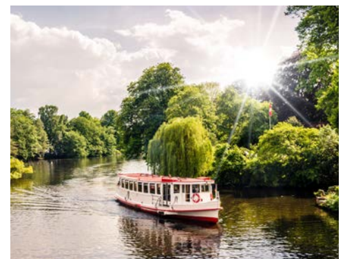
... und Außenalster