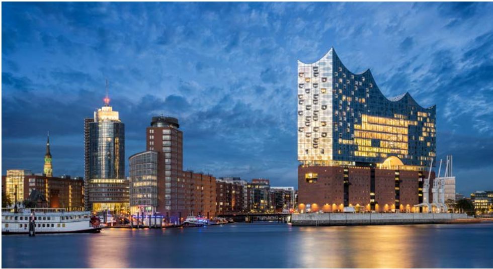
Die Elbphilharmonie erwartet Sie

Wahrzeichen und der weltgrößte zusammenhängende Lagerhauskomplex. Gebaut wurde sie ab 1883, fünf Jahre bevor Hamburg seinen Freihafen erhielt. Die Lagerhäuser sind auf Eichenpfählen gebaut und das Viertel ist durchzogen von den sogenannten Fleeten – Kanälen, die je nach Gezeitenstand geflutet sind und dann auch mit dem Schiff befahren werden können. Sie erfahren, warum der Teppichhandel die Speicherstadt einst gerettet hat, nun aber langsam verschwindet. Hier werden Sie um 11.00 Uhr in einem alten Speicher begrüßt.