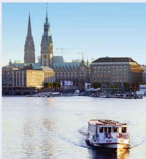
Schiffsfahrt auf der Binnenalster ...