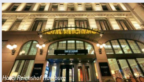
Hotel Reichshof Hamburg

Das Hotel Reichshof Hamburg gehört zu den traditionsreichsten Häusern der Stadt und verfügt über eine beeindruckende, teilweise denkmalgeschützte Einrichtung, in der Geschichte und Tradition auf Moderne treffen. Die 278 Zimmer bieten einen erholsamen Rückzugsort. Zu den Annehmlichkeiten gehören kostenloses WLAN, SuitePad, Safe, Tee- und Kaffeezubereiter, Bügeleisen, beleuchteter Kosmetikspiegel und Regendusche. Das Hotel verfügt auch über einen 250 m 2 großen Fitness- und Wellnessbereich mit 2 Saunen und einer exklusiven Ruhelounge (gegen einen Aufpreis). Von dem 170 m entfernten Hauptbahnhof Hamburg erreichen Sie bequem die vielen verschiedenen Teile der Stadt. Die Haupteinkaufsmeile Mönckebergstraße liegt 500 m entfernt, und die Alster sowie das Rathaus von Hamburg erreichen Sie innerhalb von 15 Gehminuten.