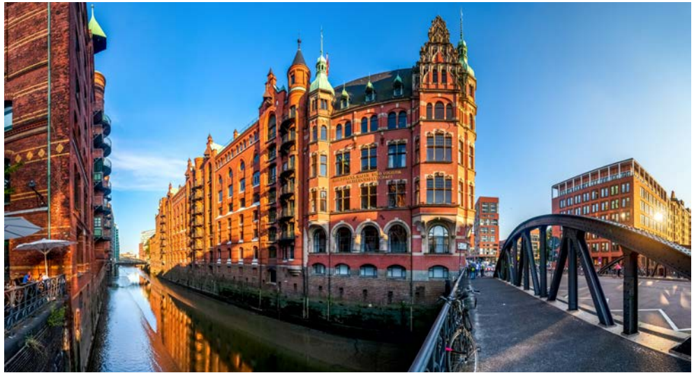
Impressionen in der Speicherstadt