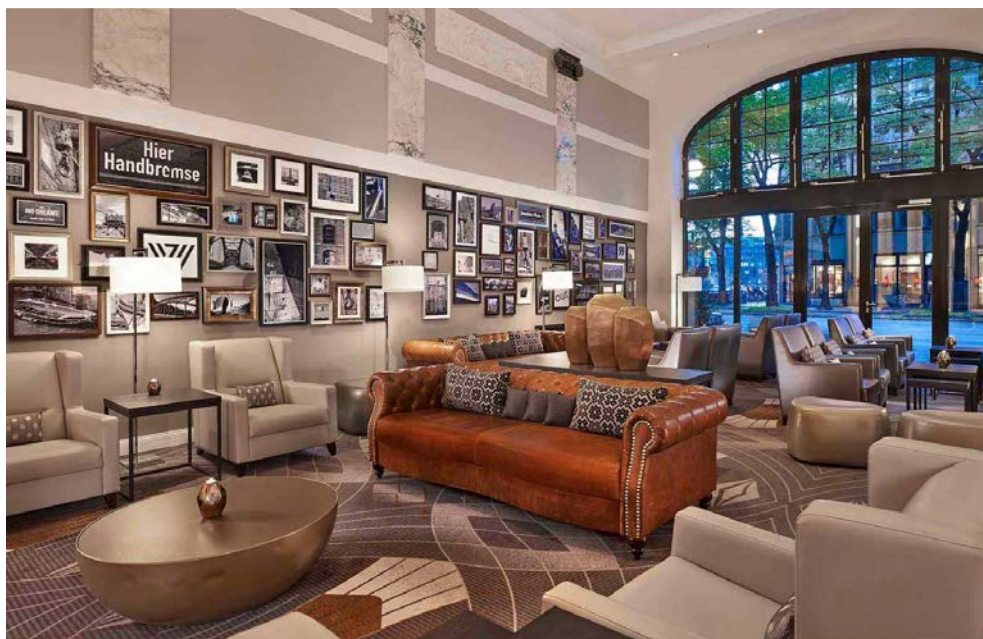
Lounge im Hotel

Zzgl. Kulturförderabgabe der Stadt Hamburg i.H.v. derzeit € 3,21 p.P./Nacht, zahlbar im Hotel.