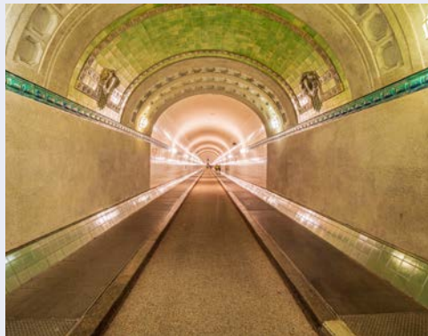
Im Alten Elbtunnel

Dazu wohnen Sie in einem Hamburger Hotelklassiker. Der Reichshof entstand 1910 gegenüber des Hamburger Hauptbahnhofs und zählte damals zu den größten Luxushotels in Europa. Seinen Namen erhielt es zu Ehren Kaiser Wilhelms II. Säulen aus italienischem Marmor, schwere Kronleuchter und aufwändige Holzarbeiten – schon beim Betreten der Lobby spürt man einen Hauch der Geschichte des Hauses. Die Gestaltung des Restaurants wurde den Speisesälen auf Kreuzfahrtschiffen nachempfunden. „Man soll sich hier fühlen, wie an Bord“ war das Motto des Gründers und in der gemütlichen Hotelbar findet man die größte Sammlung an Single Malt Whiskys in Hamburg.