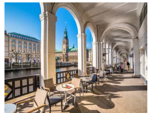
Bummeln Sie durch die Alster-Arkaden