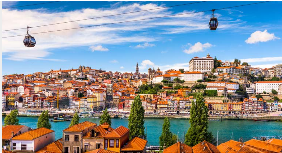
Statten Sie unbedingt Porto einen Besuch ab

mit der Oberstadt von Lissabon – ein echtes Erlebnis! Auch das Hieronymus-Kloster ist UNESCO-Weltkulturerbe und unbedingt einen Besuch wert.