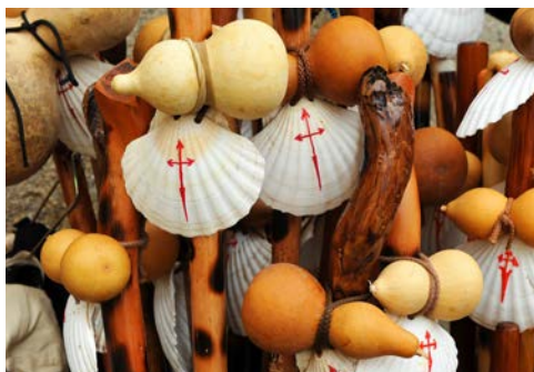
Vielleicht „pilgern“ Sie ein Stück des Jakobswegs entlang?

Entdecken Sie an Bord Ihres Wohlfühl Schiffes die reiche Auswahl an kulinarischen Höhepunkten. Dank der Mein Schiff ® Premium-Inklusivleistungen genießen Sie ein umfangreiches Getränkeangebot in allen Bars und Lounges.