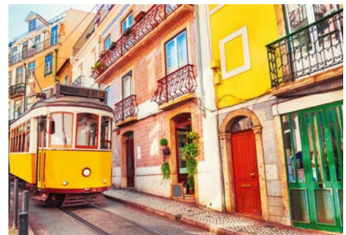
Fahren Sie mit der historischen Straßenbahn in Lissabon!

Flamenco, weiße Dörfer, Sherry und spanische Reitkunst – willkommen im andalusischen Cádiz, die älteste Stadt Spaniens! Kolumbus' Schiffe brachten unermessliche Reichtümer in die Stadt, da sie im 17. Jh. über das Handelsmonopol für die Neue Welt verfügte. Von dieser glanzvollen Zeit zeugen noch heute zahlreiche Prachtbauten. Vielleicht unternehmen Sie einfach einen Spaziergang durch das alte Stadtzentrum von Cádiz und entdecken die Camera obscura im Torre Tavira, einst der offizielle Wachturm von Cádiz mit fantastischer Aussicht.