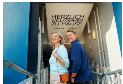
Willkommen an Bord der Mein Schiff 1