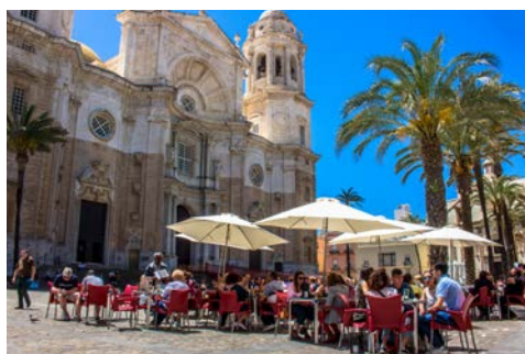
Cádiz wird Ihnen sicher gut gefallen

Wie schön, eine Kreuzfahrt mit einem entspannten Tag auf See zu beginnen. Lernen Sie Ihr Schiff in Ruhe kennen und genießen Sie die Annehmlichkeiten.