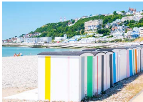
Am Strand von Le Havre