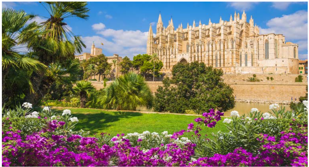
Beeindruckend – die Kathedrale La Seu in Palma

Freuen Sie sich auf eine traumhafte Frühlingsreise, die Ihnen bereits Anfang Mai ein herrliches Sommervergnügen verspricht. Den Auftakt bilden entspannte Tage auf Mallorca bei Temperaturen über 20 Grad – das perfekte Wetter, für Ihre aktive Erholung. Ihr Hotel nahe Palma bietet Ihnen viele Annehmlichkeiten, darunter ein Wellnessbereich sowie eine schöne Poolanlage. Erleben Sie dann an Bord der Mein Schiff 1 die Höhepunkte Westeuropas. Malerische Altstädte mit schmalen Gassen und zauberhaften Cafés erwarten Sie ebenso wie fantastische Panoramen, großartige Traditionen und moderne Architektur. Derweil werden Sie an Bord der Mein Schiff 1 rundum verwöhnt – mit stilvollem Ambiente, abwechslungsreichen Programmen und den tollen Mein Schiff® Premium-Inklusivleistungen .