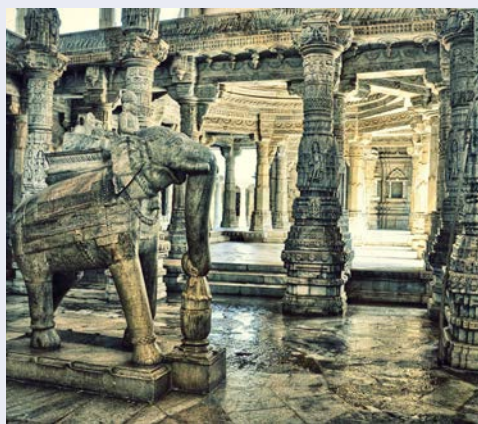
Jaina Tempel in Ranakpur