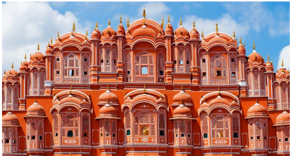
Palast der Winde in Jaipur