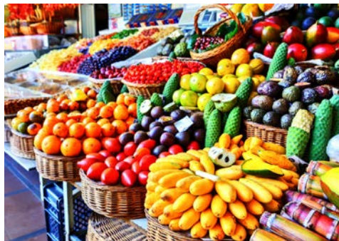
Markt in Funchal

Auf Madeira empfängt Sie Ihre Deutsch sprechende Reiseleitung und es erfolgt der Transfer zu Ihrem Hotel in Funchal. Beim Empfangsgetränk erhalten Sie Informationen zu Land und Leuten. Abendessen und Übernachtung im Hotel.