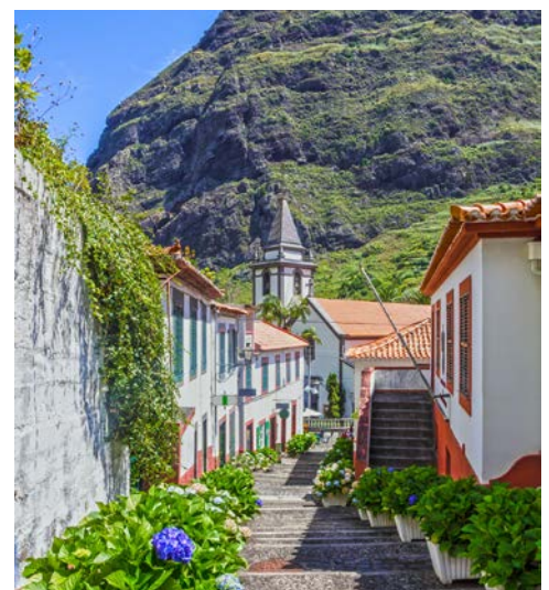
São Vicente – pittoresk