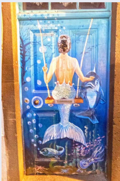
Türen Funchals – wunderschön bemalt!

Entspannen Sie sich heute in Ihrer Hotelanlage oder unternehmen Sie Erkundungen auf eigene Faust. Die Reiseleitung unterbreitet Ihnen gerne Vorschläge hierfür oder bietet Ihnen zusätzliche organisierte Ausflüge an.