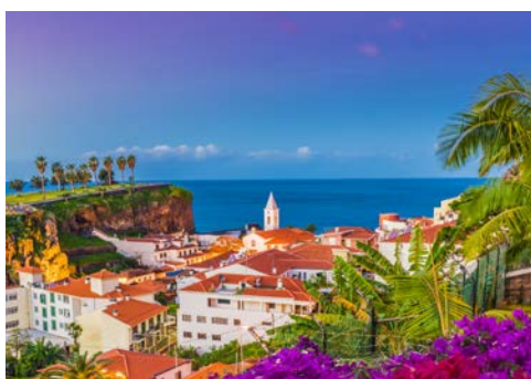
Zauberhaftes Câmara de Lobos