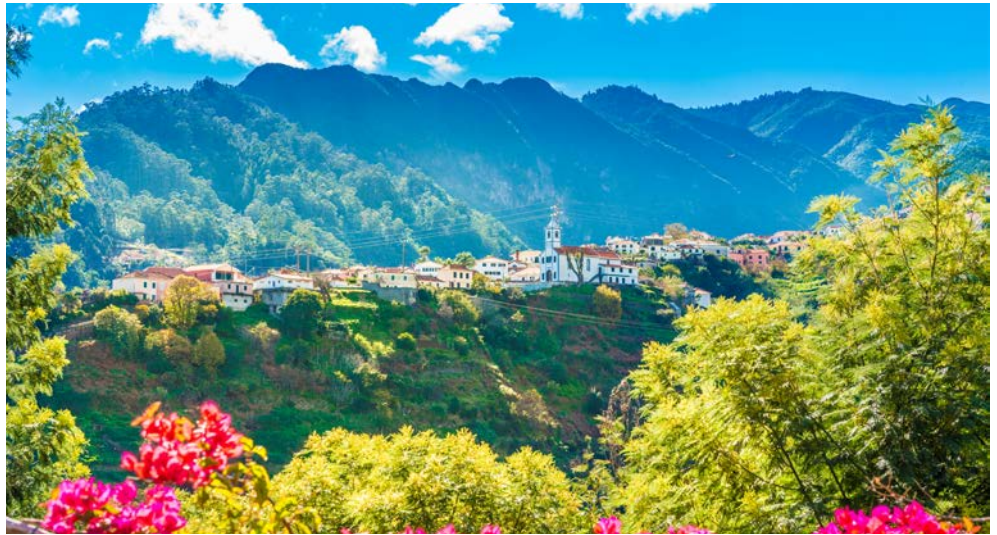
Madeira – so grün!

Bem vindo – willkommen auf Madeira, der Perle im Atlantik! Die Hauptstadt Funchal reizt mit einem historischen Stadtkern und einer herrlich grünen Uferpromenade. Saftige Lorbeerwälder (UNESCO Naturerbe) und hohe Berge, schroffe Felsküsten mit spektakulären Panoramen wollen entdeckt werden. Eine bunt blühende Blumenpracht begeistert nicht nur in den fantastisch angelegten Gärten, sondern auch am Wegesrand. Urige Fischerdörfchen konkurrieren mit wildromantischen Tälern um Ihre Gunst. Ein Netz von Pfaden entlang der Levadas, alte Bewässerungskanäle, bringt Sie ins Inselinnere. Madeira ist voller Gegensätze – und der sprichwörtlich „ewige Frühling“ ist hier keine Legende. Genießen Sie abwechslungsreiche Tage auf dieser traumhaften Insel mitten im Atlantik!