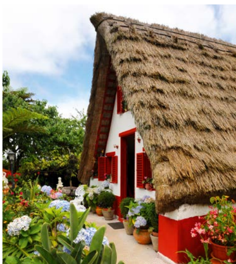
Santanas berühmte Häuser

Heute entdecken Sie den Ostteil der Insel. Zuerst geht die Fahrt nach Camacha, einem Städtchen in 700 m Höhe. Weiter fahren Sie am Fuße des Pico do Ariero entlang nach Ribeiro Frio, bekannt durch die Forellenzucht. In Santana, der nächsten Etappe Ihrer Besichtigung, lernen Sie die bunt bemalten, strohbedeckten Häuser Madeiras kennen. In der Nähe legen Sie eine Mittagspause ein. Über den Porto da Cruz und den Portela-Pass erreichen Sie Sao Lourenco, den östlichsten Punkt Madeiras. Die Rückfahrt führt über Carniçal zurück nach Funchal. Abendessen und Übernachtung im Hotel.