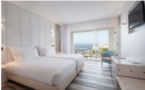
Zimmerbeispiel im Hotel

Inklusive Direktflüge mit Condor von Hamburg nach Funchal und zurück in der Economy Class sowie alle erforderlichen Transfers vor Ort.