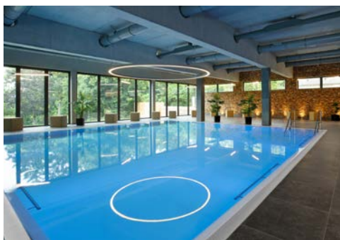
Das neue Solebad mit ca.34°C warmem Wasser