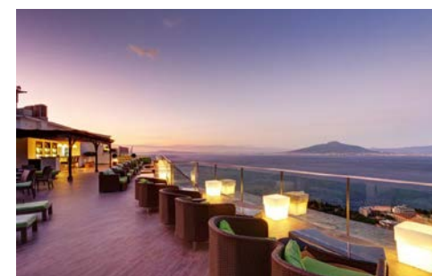
Herrlicher Ausblick von der Dachterrasse