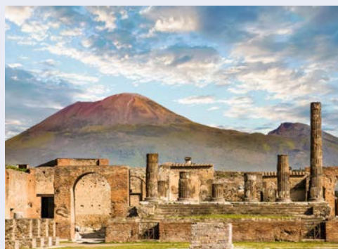
Pompeji – ein Muss für jeden!

(*Termin regulär oder als separates Single-Special nur für Alleinreisende buchbar!)