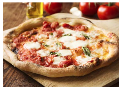
Ein Klassiker – Pizza Napoletana