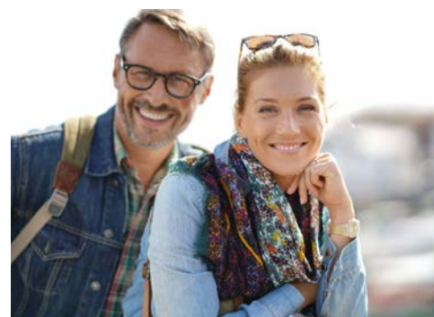
Genießen Sie die abwechslungsreiche Zeit

*07.10.2024 TM8287 | 14.10.2024 TM8288 21.10.2024 TM8289 | 28.10.2024 TM8290 04.11.2024 TM8901 | 04.11.2024 TM8902 (Single-Special)