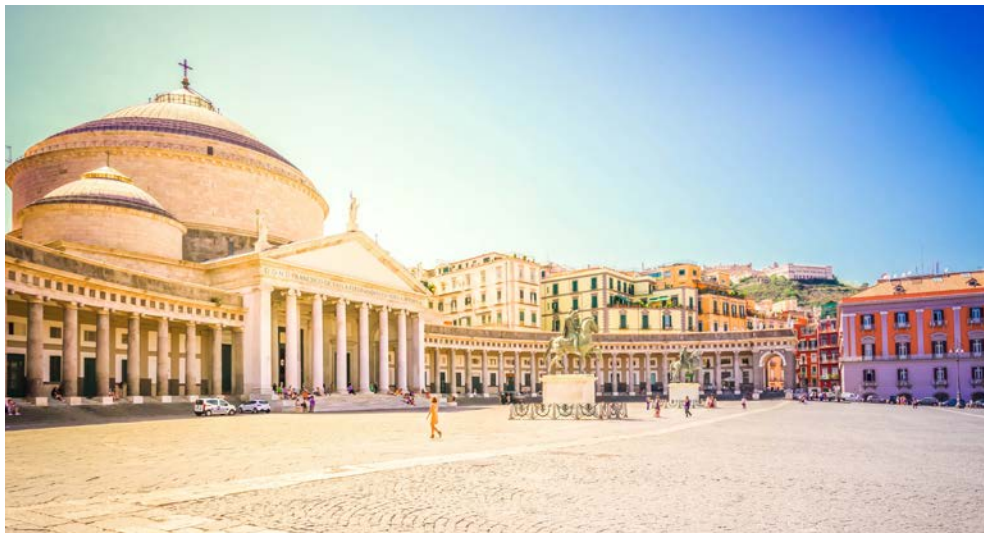
Neapel – Piazza Plebiscito

Sorrent durch die Architektur in Form eines lateinischen Kreuzes beeindruckt. Die Kathedrale wurde zwar bereits im 11. Jahrhundert errichtet, aber im 15. Jahrhundert im Stil der Romanik sowie der Renaissance komplett erneuert. Sie besitzt eine Kanzel mit eleganten Marmorsäulen und -platten, in deren Mitte sich ein Flachrelief der Taufe Christi befindet. Sehenswert sind hier auch die prächtige Orgel aus dem Jahr 1897 und das geschnitzte Chorgestühl aus kaukasischem Nussbaumholz mit seinen Heiligendarstellungen. Im Anschluss an die Stadterkundung geht es per Bus weiter ins Hinterland. Dort lernen Sie einen typischen Agriturismus, einen Bauernhof, kennen. Hier erfahren Sie, wie Öl und Limoncello produziert werden, und eine Bäuerin erklärt, wie leckerer Mozzarella hergestellt wird. Bei einem kleinen Imbiss gibt es zudem Köstlichkeiten aus der Eigenproduktion zu probieren. Lassen Sie sich den herzhaften Käse, Salami, Oliven, eingelegte Auberginen und den hausgemachten Mozzarella schmecken! Weißwein, Wasser und eine Kostprobe des Limoncellolikörs gehören ebenso zum leiblichen Wohl.