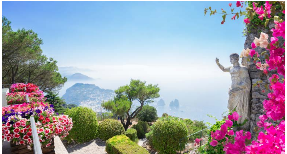
Capri – traumhafte Aussichten von den Augustusgärten