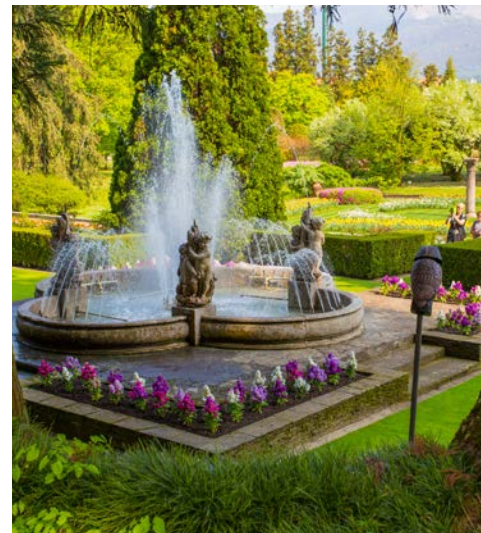
Zauberhaft – Botanischer Garten der Villa Taranto

Heute unternehmen Sie einen Ausflug an den Lago d’Orta mit der weltbekannten Basilika San Giulio auf der Insel San Giulio, die Sie per Boot erreichen. Im Inneren erwarten Sie kostbare Elemente der spätgotischen und barocken Epoche. Das pittoreske Städtchen Orta San Giulio mit seinen engen Gassen und der mittelalterlichen Piazza Motta lädt zum Bummeln und zum Verweilen ein.