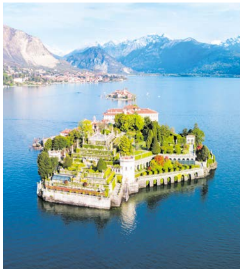
Die Isola Bella, „die schöne Insel“ im Lago Maggiore