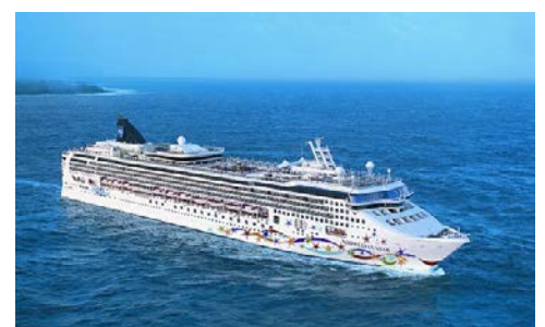
Ihr Schiff – willkommen an Bord!