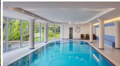
Hotel Olympia – Zimmerbeispiel, Reha-Bassin

Das Spa & Wellness Hotel Olympia (Landeskategorie 4 Sterne) wurde im „klassischen Marienbader Stil“ erbaut und liegt im oberen Abschnitt der Kurzone, in der Nähe des Waldes am Rand der Zentralparkanlage mit der Hauptpromenade (leichte Steigung). Es ist ca. 300 Meter von der Kolonnade und der Singenden Fontäne entfernt. Das moderne Balneo-Zentrum bietet eine komplette und kompetente medizinische Pflege. Natürliche heilende Ressourcen: in der Balneotherapie verwendet das Hotel ein zertifiziertes schwefel-eisenhaltiges Moor (einzigartige Anwendungen: kleine und große Naturmoorpackungen) und die zertifizierte Wald-Quelle (einzigartige Anwendungen: Inhalation und Inhalationstherapie FASET).