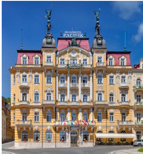
Health Spa Hotel - Ensana Pacifik