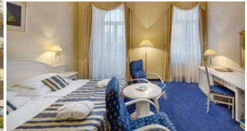
Health Spa Hotel - Ensana Pacifik, Zimmerbeispiel