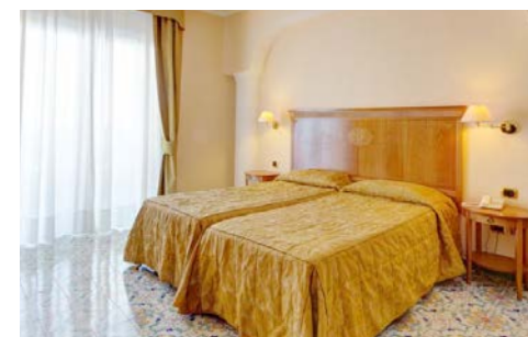
4-Sterne Grand Hotel President – Zimmerbeispiel