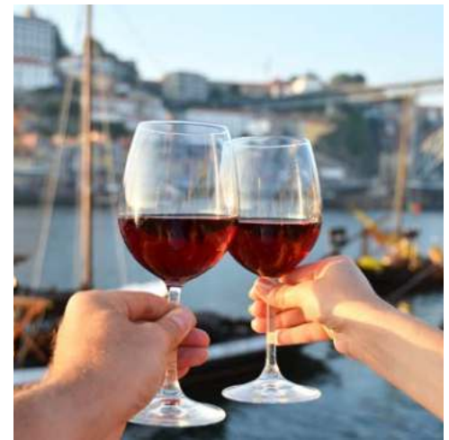
Genießen Sie ein Glas Portwein in der Sonne