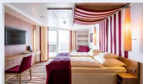
Kabinenbeispiel mit Veranda