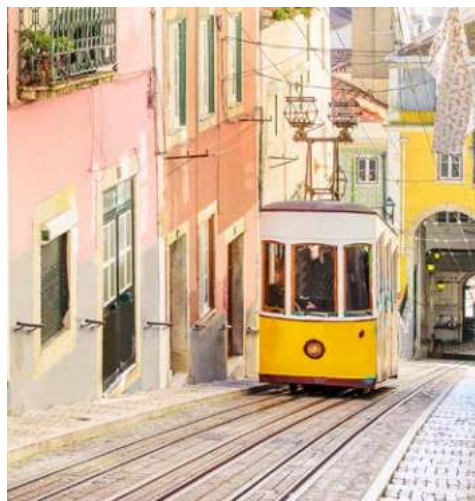
Elevador da Bica in Lissabon

Im Nordwesten Spaniens, wo die Römer das Ende der Welt vermuteten, liegt die Kathedrale von Santiago de Compostela. Von La Coruña bietet sich ein Besuch des bekannten Wallfahrtsortes an. Bekannt wurde er im Mittelalter durch die Pilger des Jakobsordens. Seit über tausend Jahren sind Millionen von Christen dorthin gepilgert. Sie kommen aus aller Welt. Ihr Ziel war und ist das Grab des Apostels Jakobus des Älteren, der unter dem Altar der Kathedrale begraben liegen soll. So jedenfalls weiß es die Legende.