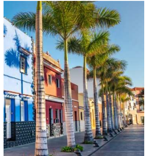
Bunte Häuser in Puerto de la Cruz

Heute heißt es für Sie Koffer packen. Ein Transfer bringt Sie zum Flughafen und Sie fliegen zurück nach Deutschland.