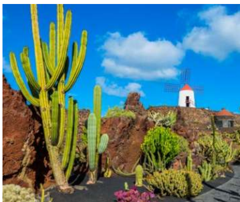
Kaktus-Garten auf Lanzarote

Auf Lanzarote beginnt eine neue Welt: Sie ist eine Insel Schönheit aus Feuer und Wasser. Zwar ist Lanzarote eine der kargsten Kanarischen Inseln, doch ihre Farbvielfalt bleibt unübertroffen. Hier eröffnen sich Ihnen Vulkanlandschaften, der Nationalpark Timanfaya mit seinen eindrucksvollen Feuerbergen und die berühmten Werke des Künstlers und Architekten César Manrique. Im Norden der Insel hat er in einem einzigartigen zusammenhängenden Höhlensystem vulkanischen Ursprungs, den Jameos del Agua, ein Zentrum für Kunst und Kultur geschaffen.