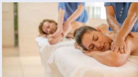
Vielleicht gönnen Sie sich eine Wellness-Behandlung?

Einzelkabinen ab € 2.799,- auf Anfrage. Sie erhalten Ihre Kabinennummer mit den Reiseunterlagen.