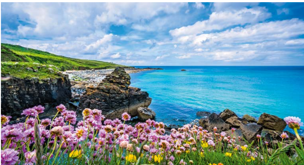
Idyllisches St. Ives