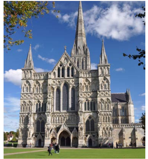
Kathedrale in Salisbury

Pilcher Romane verfilmt wurden. Nach einem Aufenthalt fahren Sie vorbei an Exeter nach Knighthayes, einem Anwesen mit einem imposanten Herrenhaus im neugotischen Stil sowie einer der schönsten Gartenanlagen Devons. Anschließend Weiterfahrt in den Raum Swindon/Reading.