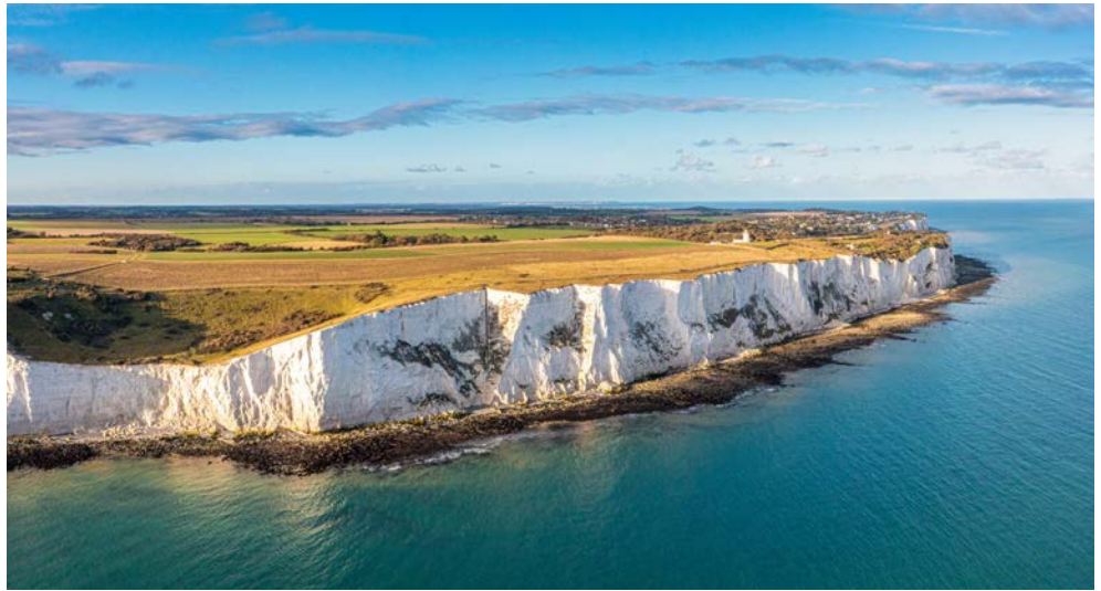
Die weißen Klippen von Dover