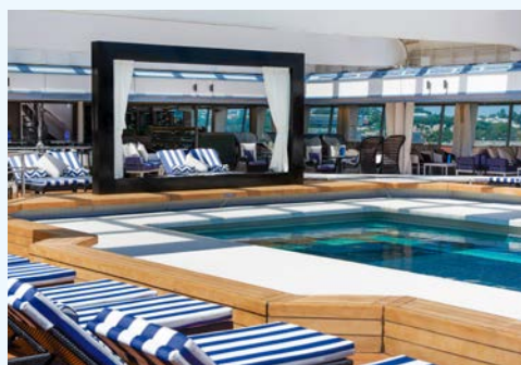
Willkommen auf der VASCO DA GAMA