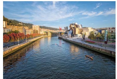
Willkommen in Bilbao

Historische Bauwerke wie der Revillagigedo Palast, bezaubernde lokale Festivals und ein abwechslungsreicher botanischer Garten erwartet Sie in der spanischen Hafenstadt Gijón!