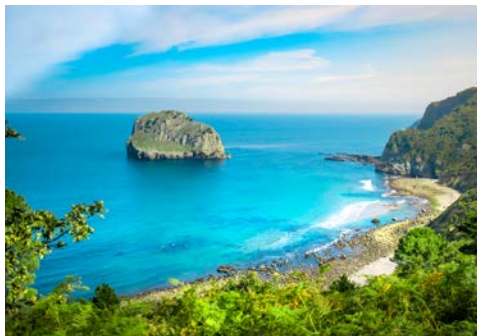
Freuen Sie sich auf eine abwechslungsreiche Reise

malerischen Häusern und ist einer der reizvollsten Orte entlang der Côte Fleurie, der „Blumenküste“. Wandeln Sie auf den Spuren von Renoir, Cézanne und anderen berühmten Malern, die in Honfleur ihre Staffeleien aufgestellt haben.