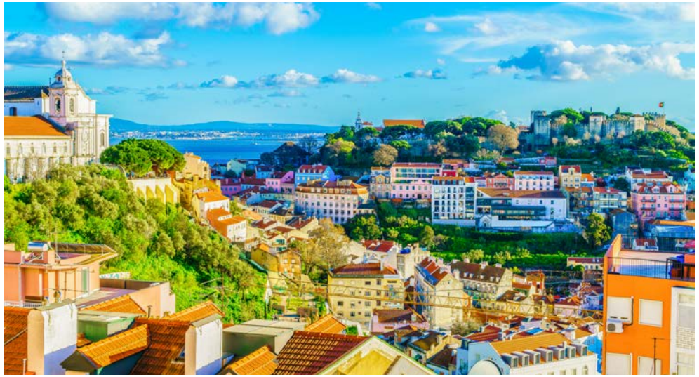
Die Altstadt von Lissabon

Verbringen Sie zu Beginn dieser schönen Reise zwei Tage in Lissabon und lernen Sie die Hauptstadt Portugals bei einer ausführlichen Stadtrundfahrt inklusive besuch des Jeronimos Kloster kennen. Im Anschluss geht es für Sie auf eine 16-tägige Kreuzfahrt mit der VASCO DA GAMA. Entdecken Sie jeden Tag eine neue Welt, ohne den Kontinent wechseln zu müssen. Diese Kreuzfahrt entlang der Westküste Europas auf der VASCO DA GAMA macht es möglich! Nachdem Sie Lissabon verlassen haben, erreichen Sie das Portwein-Mekka Porto. Weiter geht es zur Kunst-Hochburg Bilbao und dem Rotwein-Zentrum Bordeaux. Hierauf machen Sie Halt an der beeindruckenden Festung von Saint-Malo, stoppen am malerischen Künstlerort Honfleur und besuchen die Weltmetropolen London und Amsterdam. In Bremerhaven gehen Sie dann wieder von Bord, mit einer Menge Erinnerungen im Gepäck.