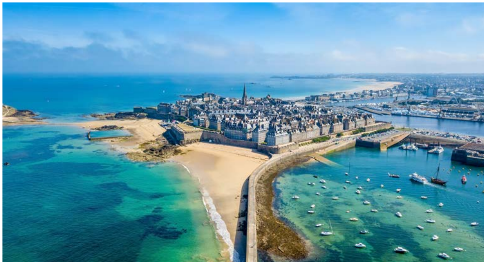
Saint-Malo – bewundern Sie hier den beeindruckenden Festungsbau