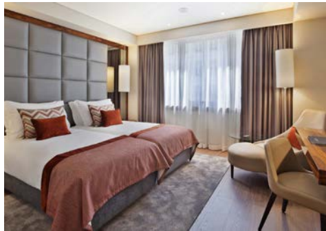
Beispiel Zimmer Turim Marques Hotel