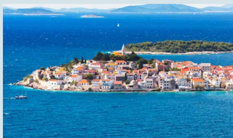
Blick auf Primošten