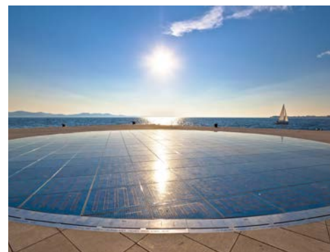
Der Platz „Gruß an die Sonne“ mit Meeresorgel in Zadar

einer schmalen Halbinsel und spiegelt mit seinen Monumenten die lebhaftige Vergangenheit unter Römern, Byzantinern und der venezianischen Herrschaft höchst eindrucksvoll wider. Über 30 Kirchen aus mehreren Epochen machen aus Zadar das „kleine Rom“. Am Forum spazieren Sie über das Pflaster aus römischer Zeit, Sie treffen auf venezianische Stadttore, Kunstschätze von unschätzbarem Wert, enge Gassen, bunte Märkte, einladende Straßencafés und mediterrane Lebensfreude – das ist Zadar! Erleben Sie zum Sonnenuntergang eines der originellsten Musikinstrumente der Welt, die berühmte „Meeresorgel“. Wellenbewegungen des Meeres erzeugen in über 35 Röhren und kleinen Öffnungen in den Treppenstufen eine mystische Musik, die Besucher aus aller Welt begeistert. Gelegentlich ist das musikalische Kunstwerk am Pozdrav Suncu, dem Platz „Gruß an die Sonne“, Amphitheater und Sonnensystem in einem 300 mehrschichtige Glasplatten, die in den Boden eingelassen wurden und die Sonne darstellen, sind umgeben von acht weiteren „Planeten Platten“. In den einzelnen Glasplatten sind Solarzellen und kleine, farbige Leuchtmittel eingebracht, die tagsüber Solarenergie sammeln, um am Abend ihre Kraft zu entladen. Doch auch tagsüber fängt und spiegelt sich die Sonne je nach Stand in facettenreicher Schönheit.