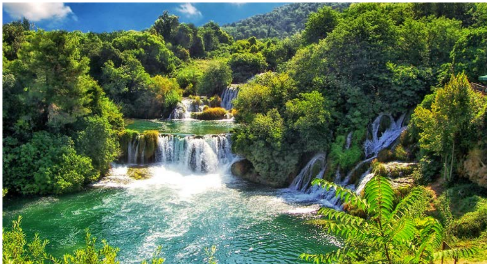
Die wunderschönen Wasserfälle im Nationalpark Krka

Familien aus den roten Korallen wertvollen Schmuck in Handarbeit an. Auf Zlarin erwartet Sie idyllischer Inselfrieden. Zahlreiche versteckte Buchten, Strände und Wanderwege durch die mediterrane Vegetation laden zu Entdeckungen auf der autofreien Insel ein.