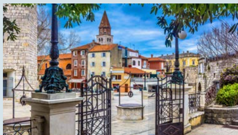
Besuchen Sie in Zadar auch den „Platz der fünf Brunnen“