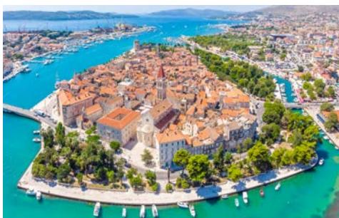
Trogir wird Sie begeistern

Sie erreichen die mitteldalmatinischen Inseln. Ein erholsamer Tag mit Badestopp in einer der zahllosen Buchten erwartet Sie. Vorbei an der Insel Drvenik läuft Ihre Motoryacht in die tiefe Bucht von Trogir ein. Das unter UNESCO-Schutz stehende mittelalterliche Städtchen ist ein Schmuckstück ohne Vergleich! Ein Labyrinth schmaler Gassen durchzieht den auf einer küstennahen Insel errichteten Ort. Zahlreiche Bauwerke im Stil der Romanik und Renaissance