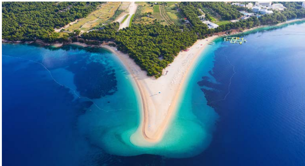
Im Schönheitswettbewerb gibt es hier nur Gewinner – Insel Brač