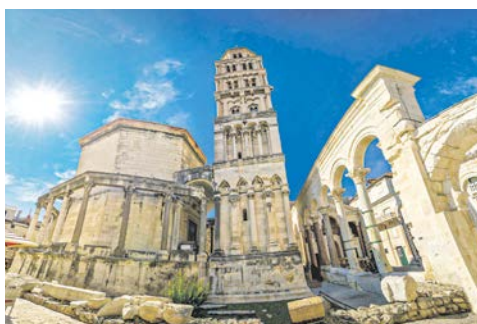
Der Diokletianpalast in Split ist beeindruckend

Sie nehmen Kurs auf Split, eine alte Römerstadt, die auf über 1700 Jahre Geschichte zurückblicken kann. Zum Ende seiner Regierungszeit zog sich der römische Kaiser Diokletian hier in seine über 30.000m 2 große Villa zurück. Dieses prächtige Bauwerk entwickelte sich später zur Keimzelle der heutigen Stadt und ist noch immer von rund 3000 Menschen bewohnt. Zu christlichen Kirchen umfunktionierte Tempel, gewaltige Säulenreihen, mächtige Stadttore und das Mausoleum des Kaisers sind erstaunlich gut erhalten und spiegeln die einstige Macht des Imperators wider. Nach der ausführlichen Besichtigung der UNESCO-geschützten Stadt besuchen Sie den größten Marktplatz Dalmatiens. Direkt am Meer, längs