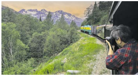
Einmalige Panoramen, spannende Tierwelt ...