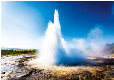
Spektakulär – Geysir in Island