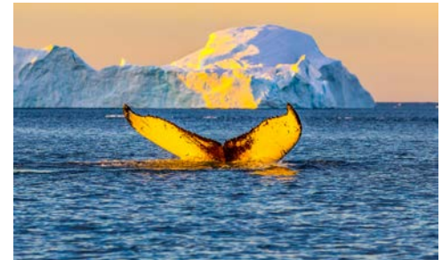
Vielleicht entdecken Sie einen Wal?

Spannende Eindrücke liegen hinter Ihnen – nun haben Sie sich Zeit und Entspannung an Bord verdient. Das Lektorenteam stimmt Sie, wenn Sie Lust haben, bestimmt auf die kommenden Reiseziele ein. Während die HAMBURG gen Island fährt, passieren Sie auch das einsame Eiland Jan Mayen, inmitten des Nordatlantischen Ozeans gelegen. Spätestens ab hier stehen die Chancen gut, von Deck aus Wale zu beobachten!