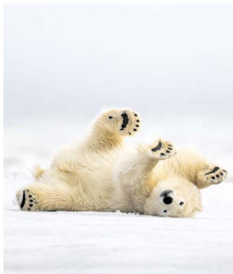
Mit etwas Glück sehen Sie Eisbären

Die reizvolle und abwechslungsreiche Fjordregion an der Küste Spitzbergens verspricht unvergessliche Eindrücke: hier und da treiben Eisschollen auf dem Meer dahin, aufragende Eisberge in der Ferne, mit etwas Glück sehen Sie Walrosse oder Wale. Wenn das Wetter mitspielt, unternehmen Sie eine Zodiacfahrt im Smeerenburgfjord, ein wahrhaft historischer Ort: Hier tauchte die „Fram“ wieder auf, nachdem sie über den Arktischen Ozean getrieben war und drei Jahre lang im Eis feststeckte! Atemberaubend ist der Magdalenenfjord, eine Mischung aus alpiner Bergwelt, steilen Felswänden und hohen Gletschern. Im faszinierenden Krossfjord liegt der Ort Barentsburg, einen Seitenarm bildet der Möllerfjord. Die Gegend ist bekannt für ihre Gletscher und sog. Nunataks, einsam aus dem Eis ragenden Bergspitzen. Der Lilliehookfjord ist durch einen 12 Kilometer langen Bergrücken vom Möllerfjord getrennt. Ihr Ziel ist Ny-Ålesund an der Südseite des Königsfjordes. Hier finden Sie das nördlichste Postamt der Welt.