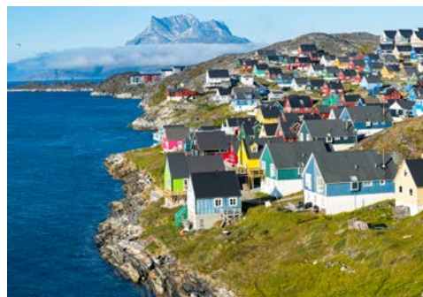
Nuuk – zwischen Bergen und Meer

Nach der Ausschiffung Rückflug nach Frankfurt und Bahnfahrt (falls gebucht) zurück zu Ihrem Heimatbahnhof.