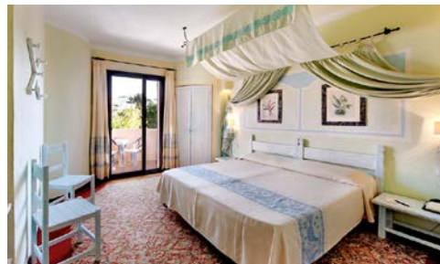
Doppelzimmer (mit „Hügelblick“)

Das Hotel Smeraldo Beach (Landeskategorie: 4 Sterne) erstreckt sich in einen üppigen, grünen mediterranen Garten und den bizarren Formen von Granitfelsen, die im Laufe der Jahrhunderte vom Wind moduliert wurden. Atmen Sie tief ein und genießen die Düfte von Heidekraut und Rosmarin. Dieses 4-Sterne Hotel in Baja Sardinia bietet 160 Zimmer, einen großen Swimmingpool, der zum Strand hin abfällt, 2 Restaurants, in denen Sie lokale und internationale Küche probieren können, und eine wundervolle Terrassenbar mit atemberaubendem Blick auf die Inseln der La Maddalena Archipel.