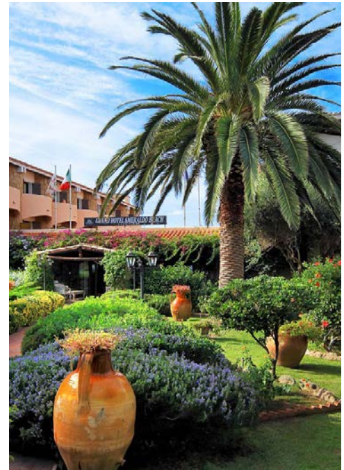
Der schöne Garten Ihres Hotels