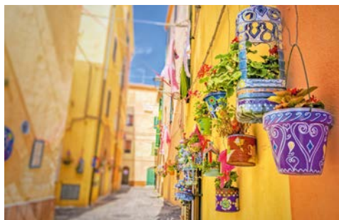
Charmante Altstadtgässchen in Alghero

Nach Ihrer Ankunft in Olbia erfolgen der Empfang durch Ihre Deutsch sprechende Reiseleitung und der Transfer zu Ihrem Hotel an der Costa Smeralda.