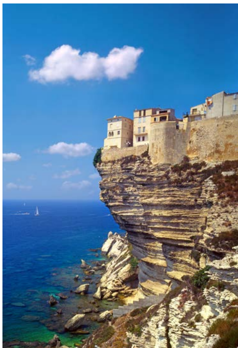
Bonifacio auf Korsika

Wenn Sie den Ausflug nach Korsika gebucht haben, führt Ihre Fahrt durch eine wunderschöne Landschaft nach Santa Teresa di Gallura. Von dort setzen Sie mit dem Schiff zur französischen Insel Korsika über (Fahrzeit ca. 1 Std.). Mit einer kleinen Eisenbahn fahren Sie nach Bonifacio. Die hoch über dem Meer gelegene Stadt mit Ihren schönen Altstadtgassen und der beeindruckenden Festungsanlage lernen Sie bei einem Stadtrundgang kennen. Anschließend bleibt Ihnen Zeit, um die französische Küche oder den lebendigen Hafen zu genießen.