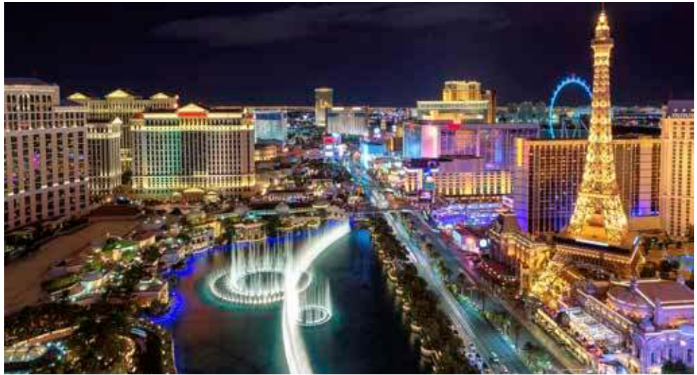
Las Vegas – spektakulär!

Manchmal werden Träume wahr ... den Auftakt Ihrer Reise macht das farbenfrohe Las Vegas, von dort aus geht es weiter nach Los Angeles mit dem legendären Hollywood. Anschließend fliegen Sie nach Honolulu auf der hawaiianischen Insel Oahu, wo Sie die PRIDE OF AMERICA erwartet. Auf dieser fantastischen Kreuzfahrtroute liegen Sie über Nacht in Maui und Kauai und entdecken zudem auch Oahu und die Große Insel (Big Island). Freuen Sie sich auf rauschende Wasserfälle, aktive Vulkane, Strände mit ihrem schwarzen, grünen und weißem Sand, historische Stätten und unberührte, paradiesische Natur. Und nach Ihrer paradiesischen Kreuzfahrt wartet noch ein Abstecher in das kosmopolitische San Francisco auf Sie.