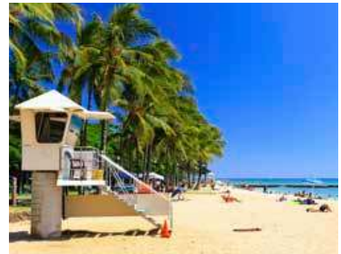
Willkommen im Paradies – Honolulu

Flug von Los Angeles nach Honolulu auf Oahu. Der große, blaue Pazifik und die atemberaubende Ko'olau-Bergkette dienen als dramatische Kulisse für die größte Stadt Hawaiis. Im Hafen liegt die PRIDE OF AMERICA für Sie zur Einschiffung bereit.