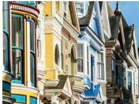
Architektur in San Francisco

San Francisco – die „Stadt an der Bucht“. Sie gilt als eine der schönsten Städte der Welt. Die Faszination dieser Weltstadt lernen Sie auf einer Panoramafahrt am Vormittag kennen. Sie sehen u.a. die Golden Gate Bridge, Chinatown, die spanischen Kirchen und Union Square. Ihre Fahrt endet am Flughafen, Rückflug nach Deutschland. Ankunft am nächsten Tag.