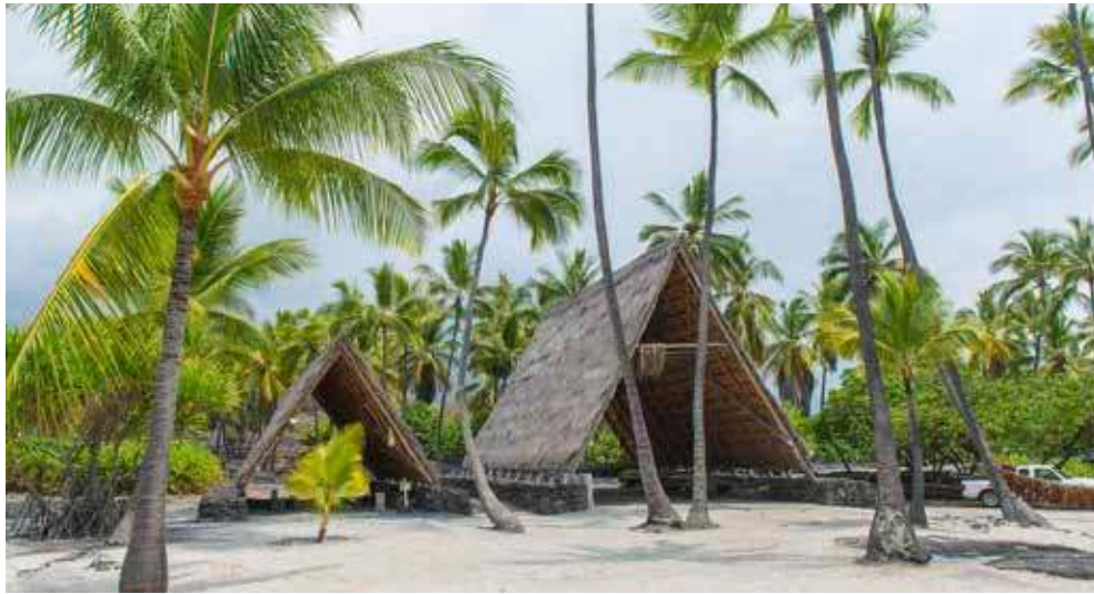
Pu'uhonua O Honaunau Nationalpark