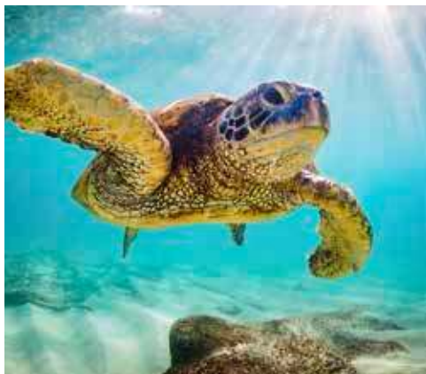
Entdecken Sie die Unterwasserwelt

Ausschiffung, Transfer zum Flughafen und Flug nach San Francisco. Hier angekommen, fahren Sie in Ihr Hotel zur Zwischenübernachtung.