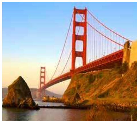
Golden Gate Bridge