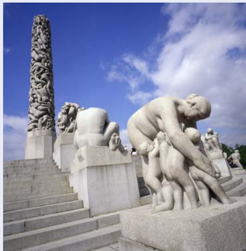
Der Vigeland Park