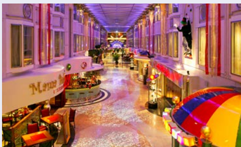
Die Promenade an Bord

Einen detaillierten Decksplan und weitere Informationen zum Schiff sowie zu Sitzplatzreservierungen für die Deutsche Bahn erhalten Sie im Internet unter der unten angegebenen Adresse.