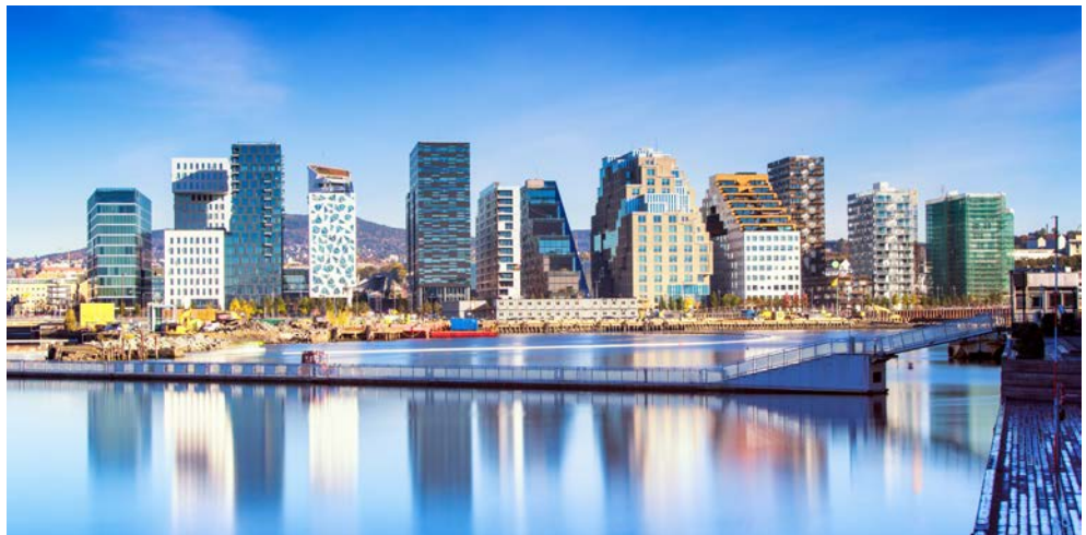
Das Hochhausviertel „Barcode“

Skulpturen im Vigeland Park und spazieren Sie auf dem Dach des imposierenden Operngebäudes. Nahe der Oper befindet sich das architektonisch beeindruckende Hochhausviertel „Barcode“. Das Rathaus von Oslo wurde 1950 eröffnet und ist für jedermann zugänglich. Der Rathausturm beherbergt das größte Glockenspiel der nordischen Länder, und im Munch-Saal kann man heiraten. Ihre Stadtrundfahrt wird abgerundet durch einen Besuch auf dem Holmenkollen. Hier haben Sie eine wunderbare Aussicht über die Stadt. Im Anschluss an Ihre beeindruckende Stadtrundfahrt werden Sie zu ihrem Hotel gebracht. Der Abend steht Ihnen für eigene Erkundungen zur Verfügung.