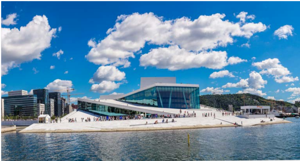
Das beeindruckende Opernhaus – neues Wahrzeichen von Oslo