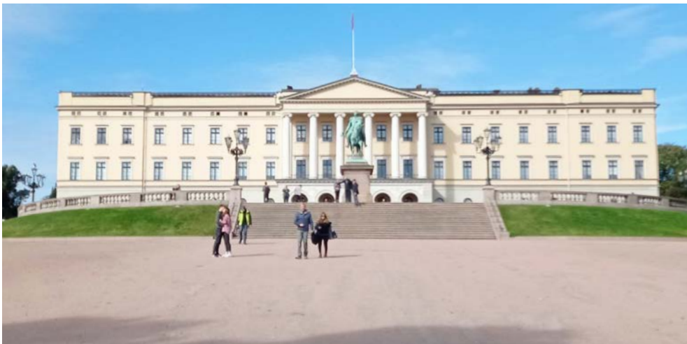
Königliches Schloss Oslo

Ankunft in Kiel und Heimreise wie gebucht.