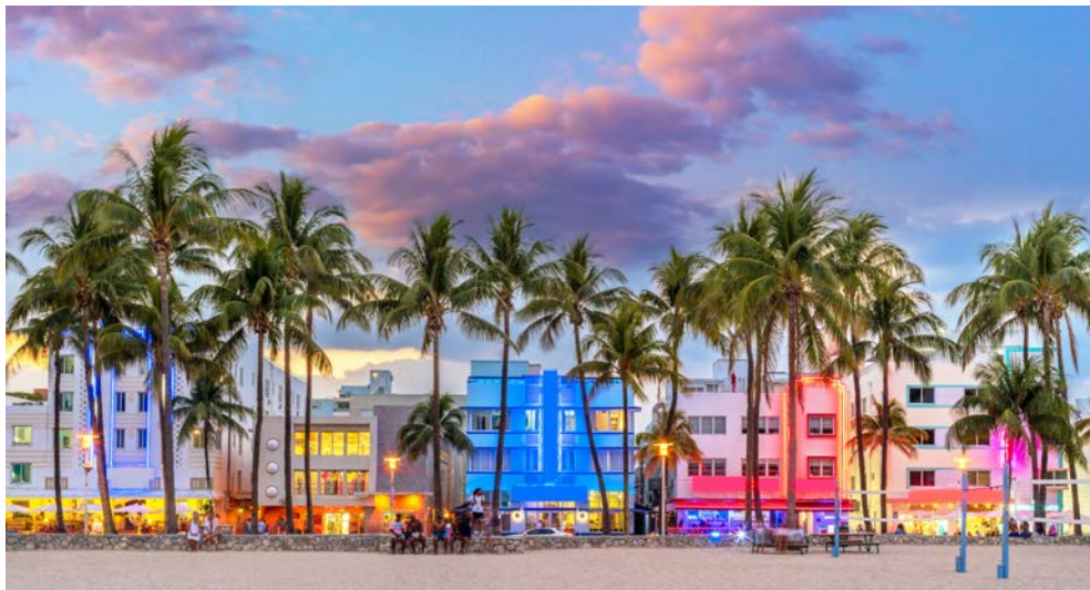
Ocean Drive in Miami