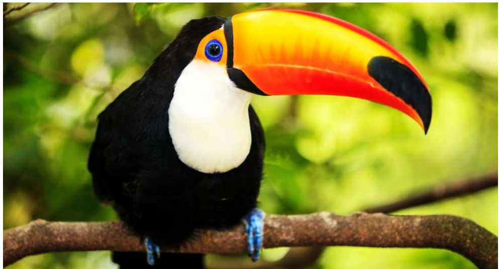
Mit etwas Glück sehen Sie Tukane in freier Wildbahn

↘ Schiff liegt auf Reede, Ausbooten wetterabhängig.