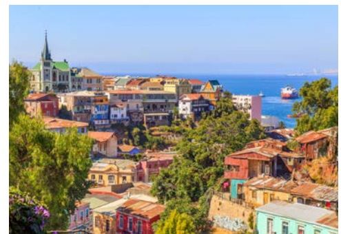
Blick über Valparaiso

Heute besuchen Sie „Valpo“ und „Viña“ – die beiden Städte liegen direkt nebeneinander und sind doch grundverschieden. Valparaiso besticht mit engen Gassen, unendlich vielen Treppen, historischen Liftanlagen und vielen Aussichtspunkten. Sie fahren durch die bunten Straßen mit ihren farbenfrohen Graffiti, die Teil des UNESCO Weltkulturerbes sind. Viña del Mar ist der bekannteste und wichtigste Badeort in Chile, mit wunderschönen Parks, langen Stränden und mediterranem Klima. Am späten Nachmittag geht es für Sie zum Hafen, hier gehen Sie an Bord der OOSTERDAM und Ihre Kreuzfahrt startet.