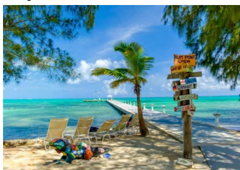
Strandleben auf den Caymans

Haben Sie eigentlich schon Ihren Lieblingsplatz an Bord gefunden?