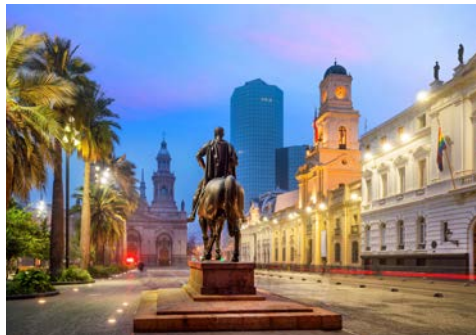
Die „Preußen Südamerikas“ werden die Chilenen genannt

Am Flughafen werden Sie von Ihrer Deutsch sprechenden Reiseleitung vor Ort empfangen und unternehmen eine orientierende Stadtrundfahrt. Chiles Hauptstadt besticht durch prachtvolle Kolonialbauten, neben modernen Hochhäusern und trendigen Cafés sowie den allgegenwärtigen Anden. Sie besuchen die Plaza de la Constitución, die das Herzstück des historischen Zentrums der Hauptstadt ist, umgeben von historischen Gebäuden, wie die Kathedrale von Santiago und dem chilenischen Postamt. In der Nähe dieses historischen Zentrums befinden sich der Zentralmarkt, das Museum der Schönen Künste, das Viertel Lastarria und der Santa Lucía-Hügel, von denen Sie einige besichtigen werden. Anschließend fahren Sie zum Hotel. Der Rest des Tages steht Ihnen zur freien Verfügung.