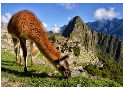
Machu Picchu ist unbedingt einen Ausflug wert!

Bergurwald erreichen. Die Schönheit ihrer Lage und die großartige Konstruktion erheben Machu Picchu zum kostbarsten Juwel aller Inkastätten. Natürlich gibt es ebenso faszinierende Ausflüge nach Lima, der Hauptstadt Perus. Die wunderschöne Altstadt aus der Kolonialzeit lädt zu einer Stadtrundfahrt ein, deren Höhepunkt das berühmte Goldmuseum ist. Oder fahren Sie entlang der Panamericana in Richtung Süden. Vorbei an Sanddünen gelangen Sie zur Inka-Ruinenstätte Pachacamac, direkt an der Pazifikküste.