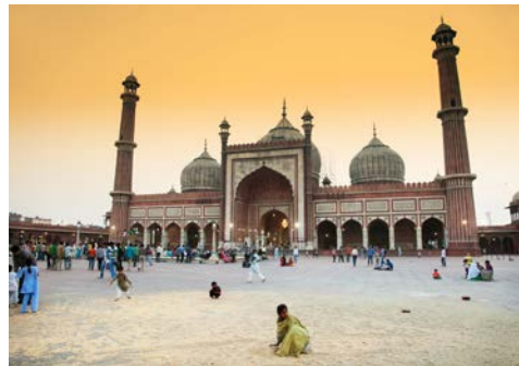
Die Moschee Jama Masjid in Delhi

Weiterreise zur verlassenem Siegesstadt Fatehpur Sikri, die Mogulkaiser Akbar im 16. Jh. als neue Hauptstadt erbauen ließ. Nach der Besichtigung gemeinsames Mittagessen und Weiterreise nach Agra, die ehemalige Hauptstadt des Mogulreiches. Hier besuchen Sie das Wahrzeichen Indiens – das Taj Mahal. Nach dem Tod seiner geliebten Frau Mumtaz Mahal wurde es von Shah Jahan erbaut und berührt nach fast 400 Jahren noch immer in seiner Schönheit die Herzen der Besucher. Von der Gartenanlage aus betrachtet, gewährt sich ein unvergesslicher Anblick auf die feinen Proportionen des prunkvollen Mausoleums. Übernachtung im Hotel. (F, M, A) (ca. 245 km)