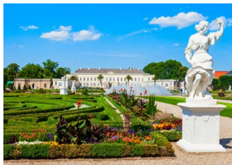
Die Herrenhäuser Gärten in Hannover

Ab Peine können Sie an einem Ausflug nach Hannover teilnehmen: Die Wahrzeichen Hannovers sind das Neue Rathaus mit der großen Kuppel und die prachtvollen barocken Herrenhäuser Gärten, die bei einem Spaziergang erkundet werden.