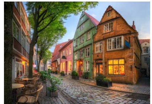
Das Bremer Schnoorviertel

Auf der trägen Weser mit ihren zahllosen Windungen und den flachen Uferlandschaften geht die Schiffsfahrt stromabwärts. Nachmittags Ankunft in der Hansestadt Bremen. Wenn Sie mögen, erkunden Sie bei einer kurzen Rundfahrt mit anschließendem Rundgang den Markt mit Dom, Rathaus und Rolandstatue, das pittoreske Schnoorviertel und die von Künstlern gestaltete Böttcherstraße mit ihrem zauberhaften Glockenspiel.