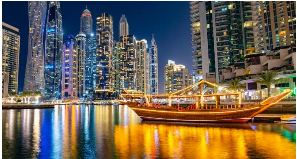
Abendliches Dubai - eine Dhow im Hafen Marina Bay

Diese Exklusiv-Reise verbindet zwei Superlative miteinander: Zunächst erwartet Sie im Übermorgenland Dubai ein traumhaftes Vorprogramm mit futuristischen Wolkenkratzern, endlosen Stränden, weltbekannten Attraktionen und geheimnisvollen Märkten. Besonders in der Vorweihnachtszeit ist hier der perfekte Ort zum Schauen, Stöbern und Shoppen – ob für sich selbst oder für die Lieben daheim. Verbringen Sie grandiose Tage voller Entdeckungen, dann folgt eine großartige Woche auf AIDAprima. Von Dubai aus durchqueren Sie den persischen Golf und besuchen Abu Dhabi und Doha sowie die märchenhafte Stadt Maskat im Golf von Oman mit der Sultan Qabus Moschee, dem zauberhaften Al Am Palast und den nach Weihrauch duftenden Gewürzmärkten. Unglaublich und exotisch!