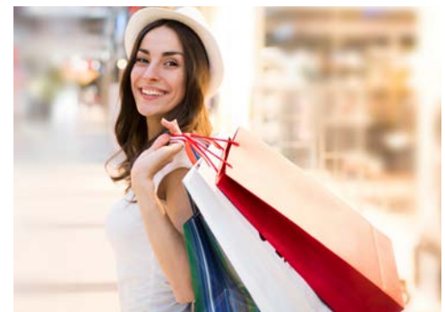
Sind Sie fündig geworden?