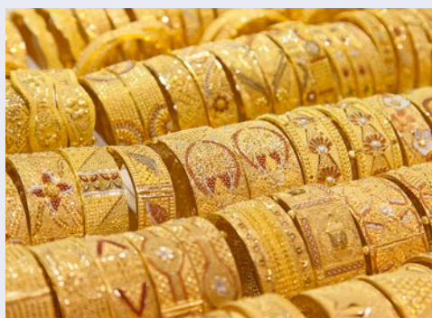
Der Goldsouq in der Dubai Mall beherbergt 220 Shops

Der Vormittag steht Ihnen für eigene Unternehmungen zur freien Verfügung. Vielleicht besuchen Sie die Marina und das „Szene-Viertel“ Downtown Burj Dubai. Das Zentrum bildet der künstliche See