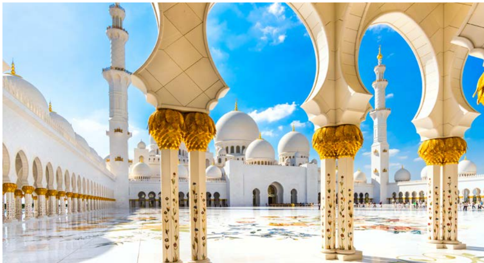
Die Sheikh Zayed Moschee