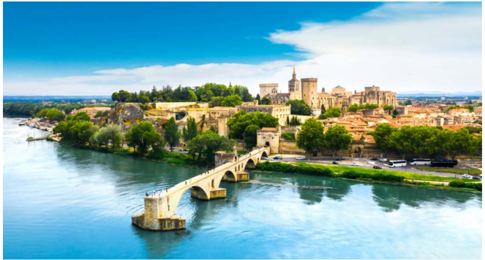
„Sur le pont d'Avignon“

Südfrankreich ist seit jeher ein Sehnsuchtsort für viele Reisende. Das Licht taucht die Landschaft in leuchtende Farben, die schon Picasso, Van Gogh und Henri Matisse inspirierte. Freuen Sie sich auf mediterranes Klima, köstliche Weine und eine fantastische Küche. Auf beiden Routen begleitet Sie die komfortabel ausgestattete A-ROSA LUNA mit großzügigen Kabinen und einem reichhaltigen kulinarischen Angebot im Buffetrestaurant. Am schönsten kann man sich treiben lassen, wenn man sich um gar nichts kümmern muss – außer um die Aussicht vom Sonnendeck. Auf dem Wasser von Stadt zu Stadt, mal gegen den Strom, mal mit ihm. Vorbei an Landschaften, die aussehen wie gemalt. Der Duft der Provence, hervorragend zusammengestellte Landausflüge und das exquisite Leben an Bord der A-ROSA LUNA ... Sie werden sich fühlen wie „Gott in Frankreich!“