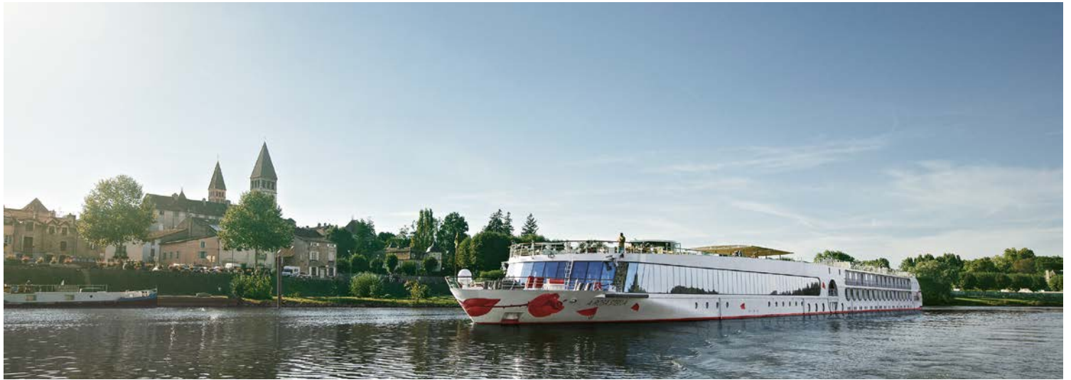
Die A-ROSA LUNA bringt Sie zu den Höhepunkten der Provence