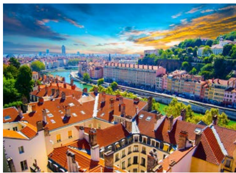
Über den Dächern von Lyon