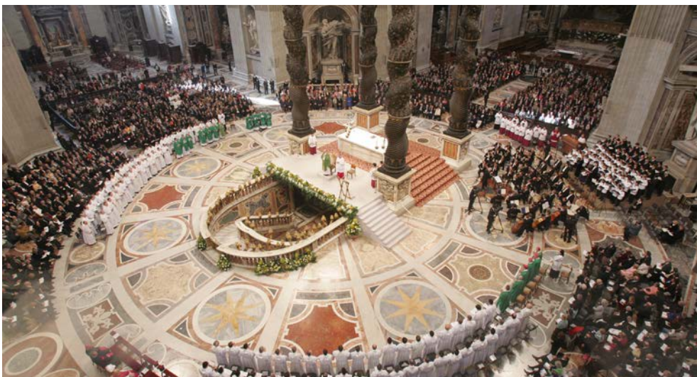
Freuen Sie sich auf fantastische Konzerterlebnisse

Besichtigung der heute unterirdisch gelegenen Domus Aurea, einst von Kaiser Nero als Kaiserpalast entworfen. Im Anschluss erleben Sie den Alltag der antiken Römer bei einer ausführlichen Führung durch das Forum Romanum, dem legendären Mittelpunkt des römischen Weltreichs. Hier spielte sich das religiöse, politische und wirtschaftliche Leben ab. Besichtigen Sie das berühmteste aller Amphitheater, das Kolosseum 80 n. Chr. errichtet, das durch seine monumentalen Ausmaße beeindruckt. Gemeinsames Abendessen und anschließendes Konzert in der Kirche des Heiligen Ignatius von Loyola am Campo Marzio aus Anlass des 200. Geburtstages von Anton Bruckner mit den St. Florianer Sängerknaben aus Österreich.