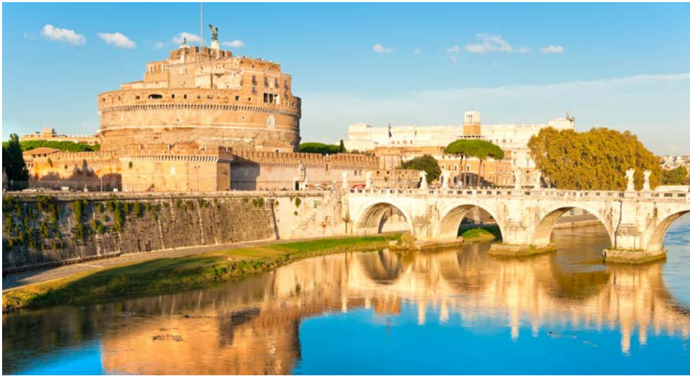
Blick auf die Engelsburg