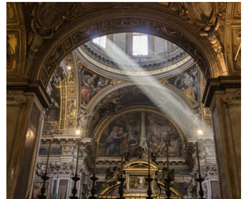
In der Basilika Santa Maria Maggiore