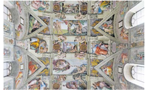
In der sixtinischen Kapelle

Heute Vormittag besteht die Gelegenheit an der wöchentlichen Papstaudienz mit Papst Franziskus teilzunehmen. Vom Wetter abhängig findet die Audienz bei gutem Wetter auf dem Peterplatz oder bei Regen in der von Luigi Nervi gebauten Audienzhalle statt. Im Anschluss Transfer zum Flughafen und Rückflug.