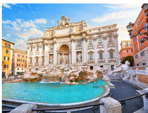
San Paolo fuori le Mura – eine der Patriarchalbasiliken