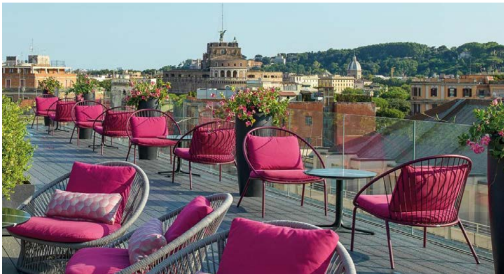
Fantastischer Ausblick von der Hotelterrasse