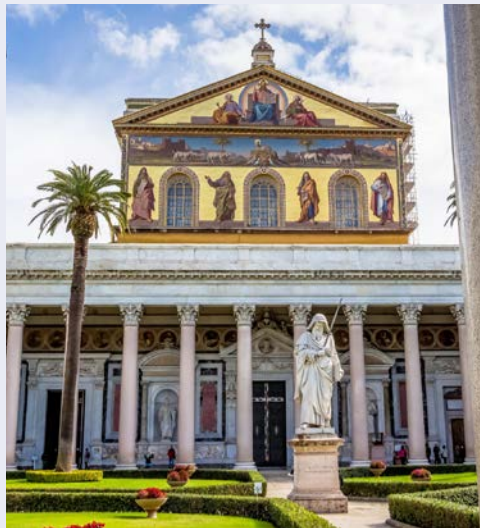
San Paolo fuori le Mura – eine der Patriarchalbasiliken

Mittags genießen Sie die Heilige Messe im Petersdom, untermalt mit der Krönungsmesse nach Wolfgang Amadeus Mozart. Der Nachmittag steht Ihnen zur freien Verfügung. Nach einem gemeinsamen Abendessen genießen Sie am Abend ein Konzert mit dem Vokalensemble des Kölner Doms in der wunderschönen, ehrwürdigen Marienbasilika Santa Maria Maggiore, die zu den vier Patriarchalbasiliken gehört. Der Legende nach geht ihre Errichtung auf ein Naturereignis im Jahre 352 am 5. August zurück, wo ein Schneefeld den Grundriss einer Basilika aufgezeigt haben soll.