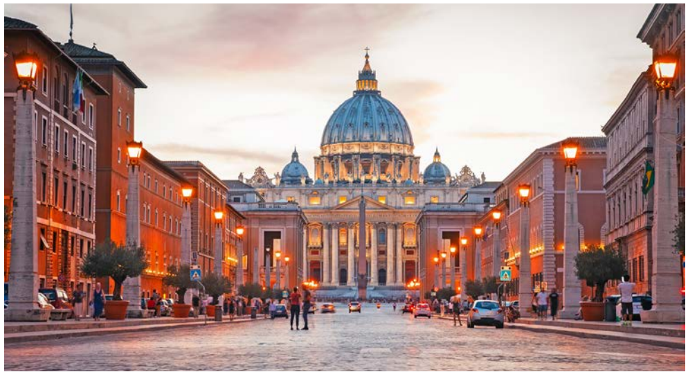
Blick auf den Petersdom – am Abend illuminiert, wunderschön

„Alle Wege führen nach Rom“, ein altes Sprichwort, das die Großartigkeit und Bedeutung der Stadt als „Caput Mundi“ – Mittelpunkt der Welt – hervorhebt. Erleben Sie einzigartige Konzerte während des XXIII. Festival Internazionale di Musica e Arte Sacra in den bedeutenden Patriarchalkirchen Roms. Betreten Sie in aller Ruhe während einer SONDERÖFFNUNG die Vatikanischen Museen mit der weltbekannten Sixtinischen Kapelle. Lernen Sie die Stadt auf sieben Hügeln, mit einer Geschichte von über 2.700 Jahren und dem kleinsten Staat der Welt, dem Vatikan, kennen, die auf jeden Besucher eine Faszination ausübt. Pulsierendes Leben auf den Straßen, knatternde Motorinos und Cafebars gehören ebenso zu Rom, wie ihre antiken Sehenswürdigkeiten, Kolosseum und Forum Romanum, Kirchen mit kostbaren Mosaik- und Intarsienarbeiten, der Petersdom, sowie ihre bedeutenden Museen, Villa Borghese und die Vatikanischen Museen mit der Sixtinischen Kapelle. Werfen Sie eine Münze in den Trevibrunnen und eine Rückkehr nach Rom ist gewiss.