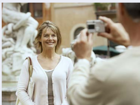
Genießen Sie die „Ewige Stadt“

Freuen Sie sich heute auf den Besuch der wunderschönen Galleria Borghese. Sie unternehmen einen Rundgang durch die prächtigen Räume der Gemäldegalerie, mit Werken von u.a. Caravaggio, Rubens und Michelangelo. Die raffinierte Innenarchitektur des 18. Jh. bringt Wandfelder und Bildformate in harmonischen Einklang. Bevor Sie am Abend ein weiteres musikalisches Highlight erwartet, laden wir Sie zu einem gemeinsamen Abendessen ein. Im Anschluss erleben Sie in der päpstlichen Basilika San Paolo fuori le Mura ein Konzert mit dem Swiss National Orchestra. Genießen Sie das Konzert in der wunderschönen, beeindruckenden Basilika, die zu den vier Patriarchalbasiliken gehört.