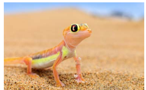
Nicht nur große Tiere sind in Namibia zuhause

Die frühen Morgenstunden sind die beste Zeit, die leuchtenden Riesendünen zu erleben. In offenen Fahrzeugen geht es bis in das Vlei. Der Aufstieg auf eine Düne wird mit weiten Ausblicken auf ein Meer aus Sand belohnt. Zum Sonnenuntergang können Sie eine Fahrt durch die Wüstenlandschaft genießen. (F/A)