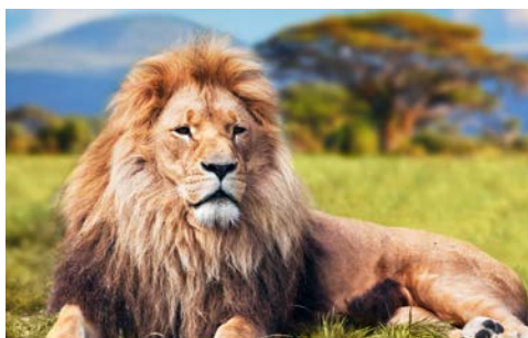
Ein kleines Idyll in der Wüste – Etosha-Nationalpark