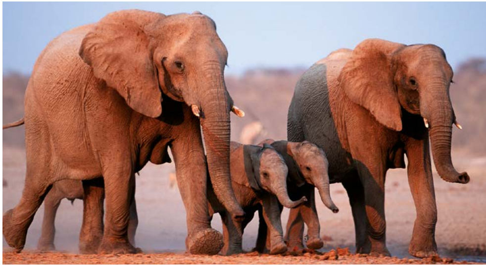
Erleben Sie Elefanten hautnah!