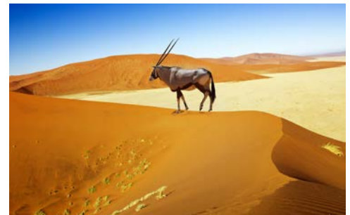
Wie aus einer anderen Welt – Sossusvlei

An der Station Holoog steigen Sie um in Busse und fahren zum Fish River Canyon. Wer möchte, kann eine Kurzwanderung am Canyon Rand unternehmen. Danach bleibt vor Sonnenuntergang Zeit für einen Kurzausflug zum Köcherbaumwald. Es erwartet Sie auch eine Biltong-Probe. (F/M/A)