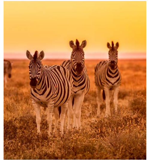
Der Etosha-Nationalpark ist voller Leben