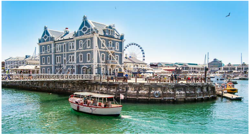
Waterfront in Kapstadt

Für alle mit *gekennzeichneten Termine ist die DB-Anreise 1. Klasse vom Heimatbahnhof zum Flughafen Frankfurt und zurück inklusive