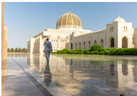
Die Große Moschee in Maskat

Region. Heute sind es Limousinen und Privatjets. Mit den Ölfunden in den 1960er-Jahren kam unermesslicher Reichtum nach Abu Dhabi und verwandelte es in eine futuristische Metropole. Schauen Sie sich um: