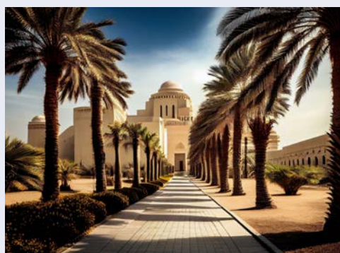
Museum für islamische Kunst in Doha