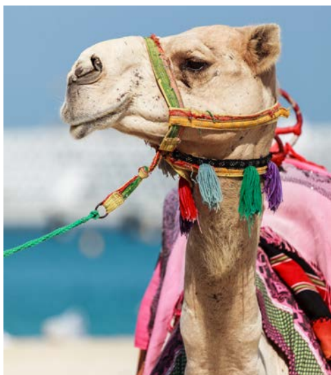
Noch immer Bestandteil der emiratischen Kultur – Kamele

Khasab ist die Hauptstadt der Halbinsel Musandam im Oman. Khasab liegt an der Nordspitze der