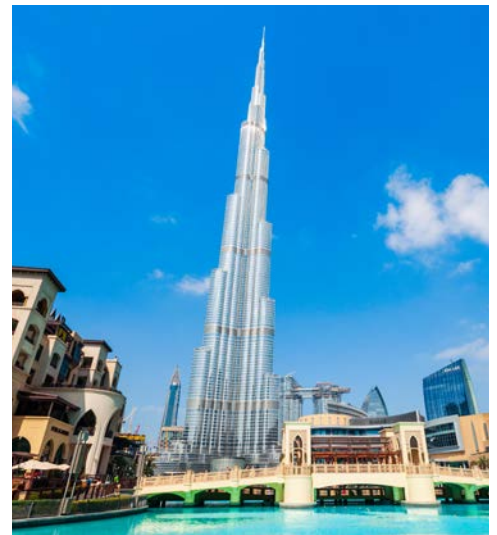
Das höchste Gebäude der Welt: der Burj Khalifa mit 828 m