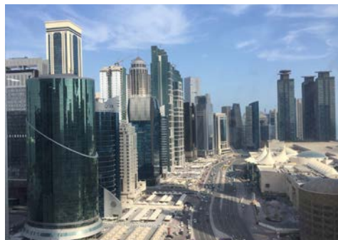
Westbay in Doha

Ihre Reise beginnt mit dem Flug nach Doha. Am Flughafen werden Sie von Ihrer Deutsch sprechenden Reiseleitung vor Ort empfangen, Transfer zum Hotel, Check-In und Übernachtung.