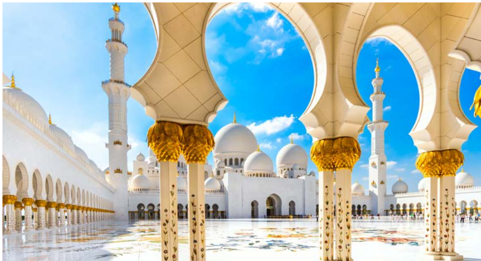
Sheikh Zayed Moschee in Abu Dhabi