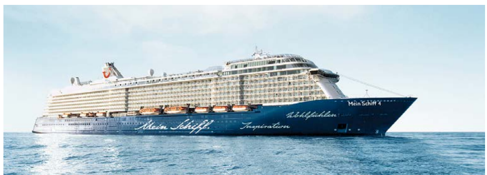
Willkommen auf der Mein Schiff 4

Vor wenigen Jahrzehnten waren hölzerne Fischerboote noch das übliche Fortbewegungsmittel der