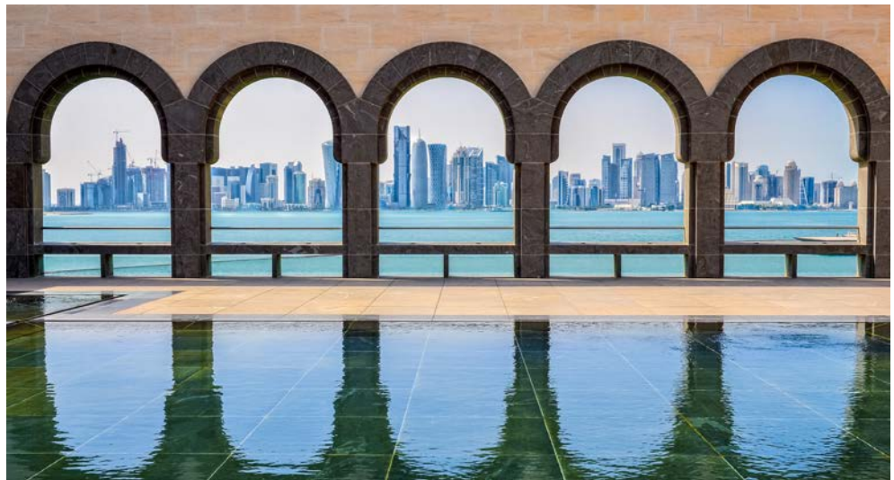
Doha – Tradition und Moderne